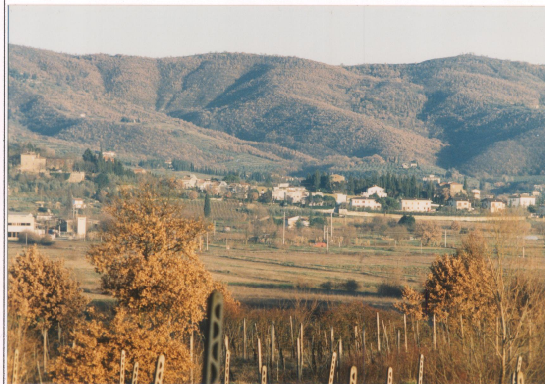
Particolare della collina di Puglia