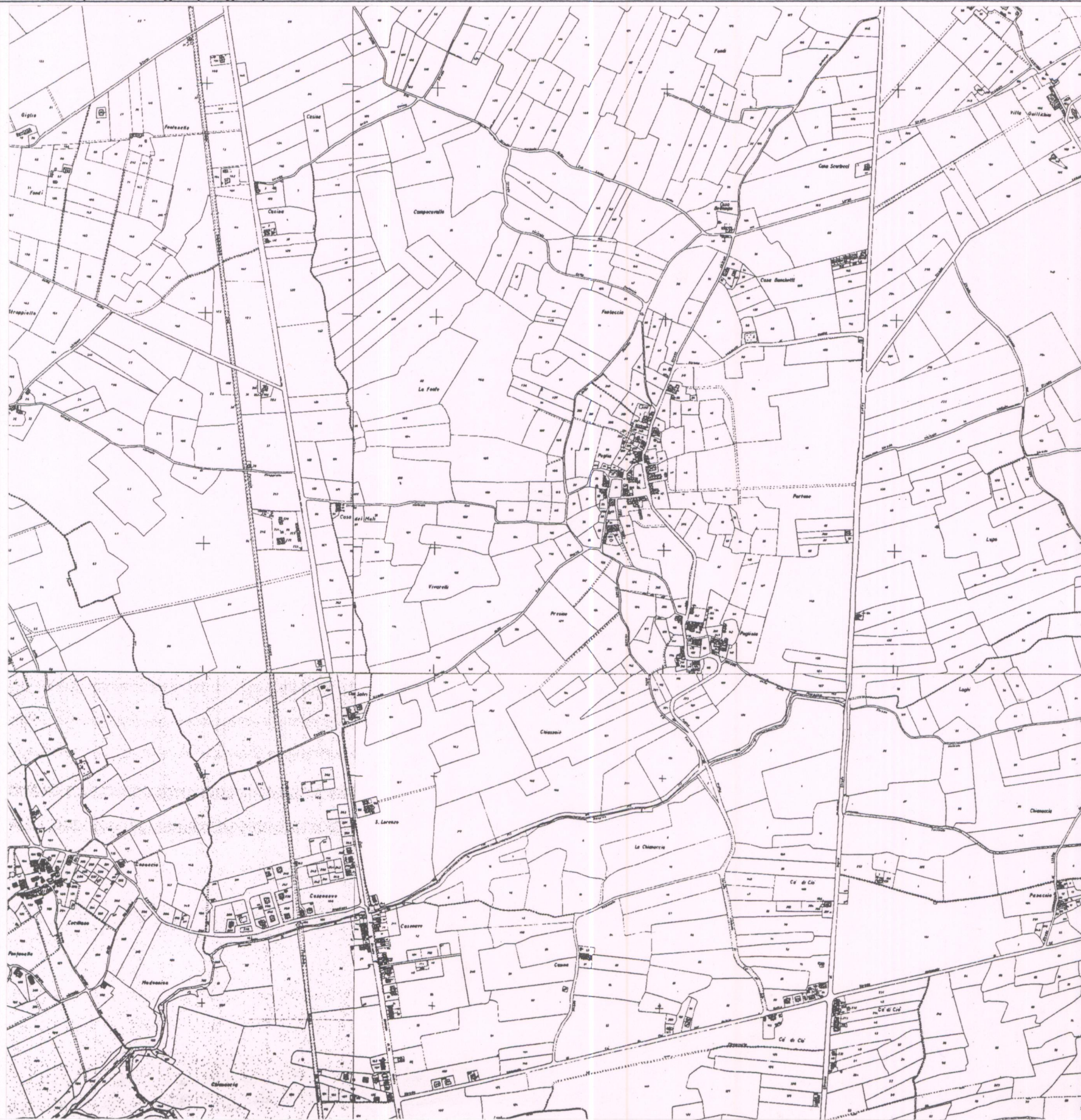
Estratto della planimetria catastale scala 1:10.000