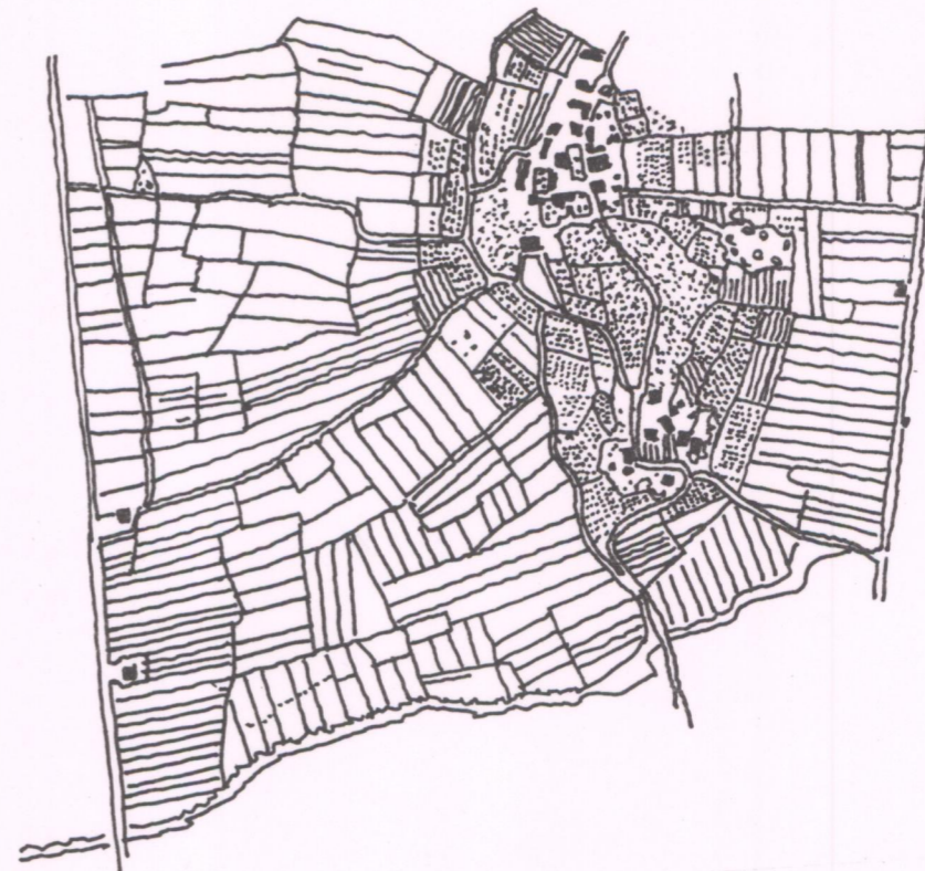
Schema della maglia agraria desunta dalla Foto Aerea del 1956