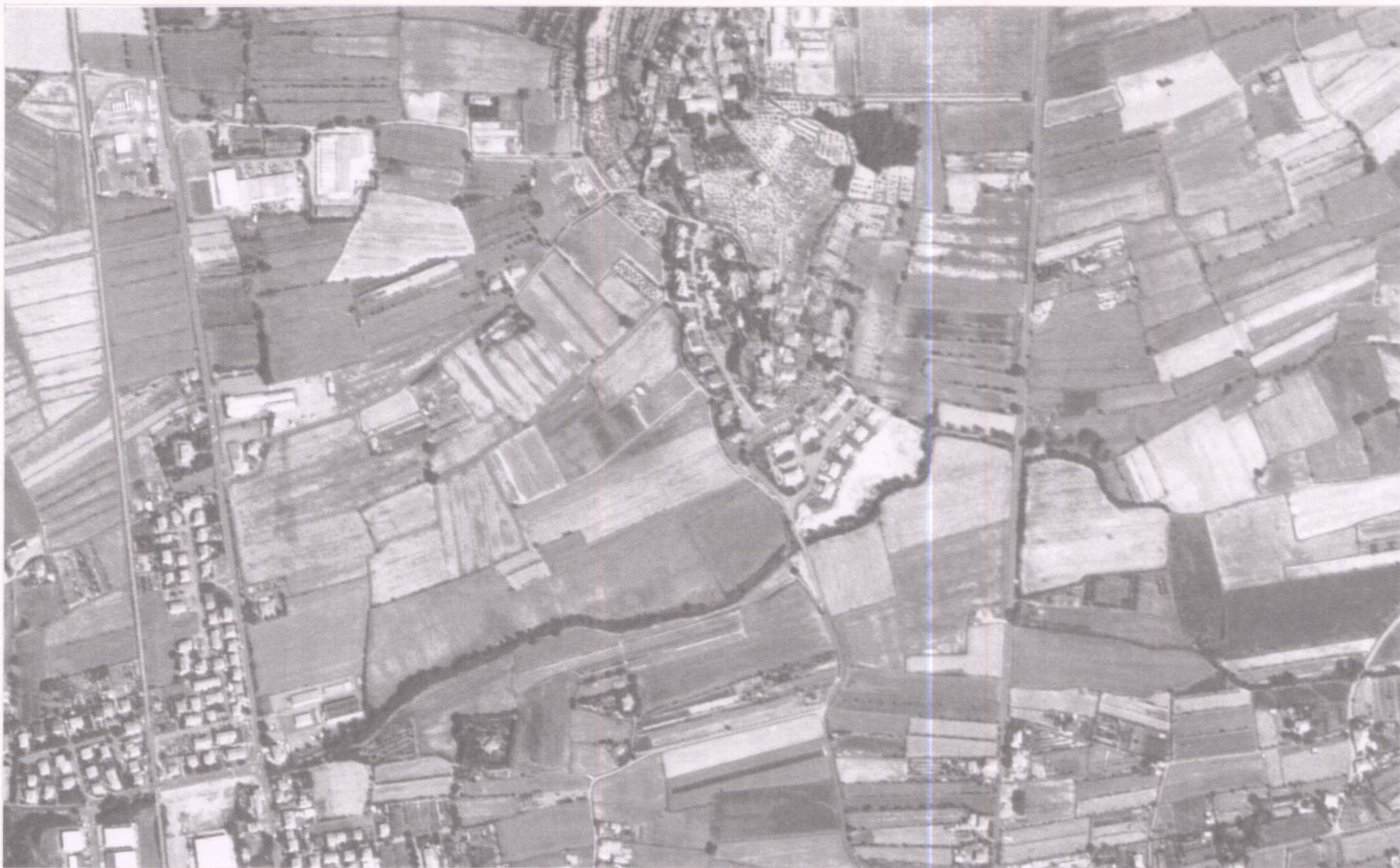
Estratto della Foto Aerea del 1994