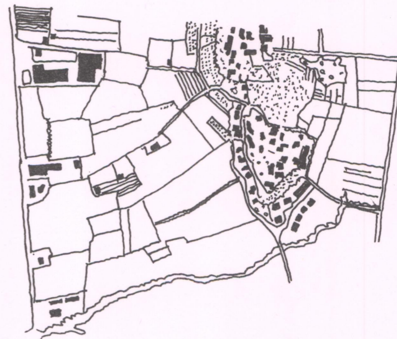
Schema della maglia agraria desunta dalla Foto Aerea del 1994