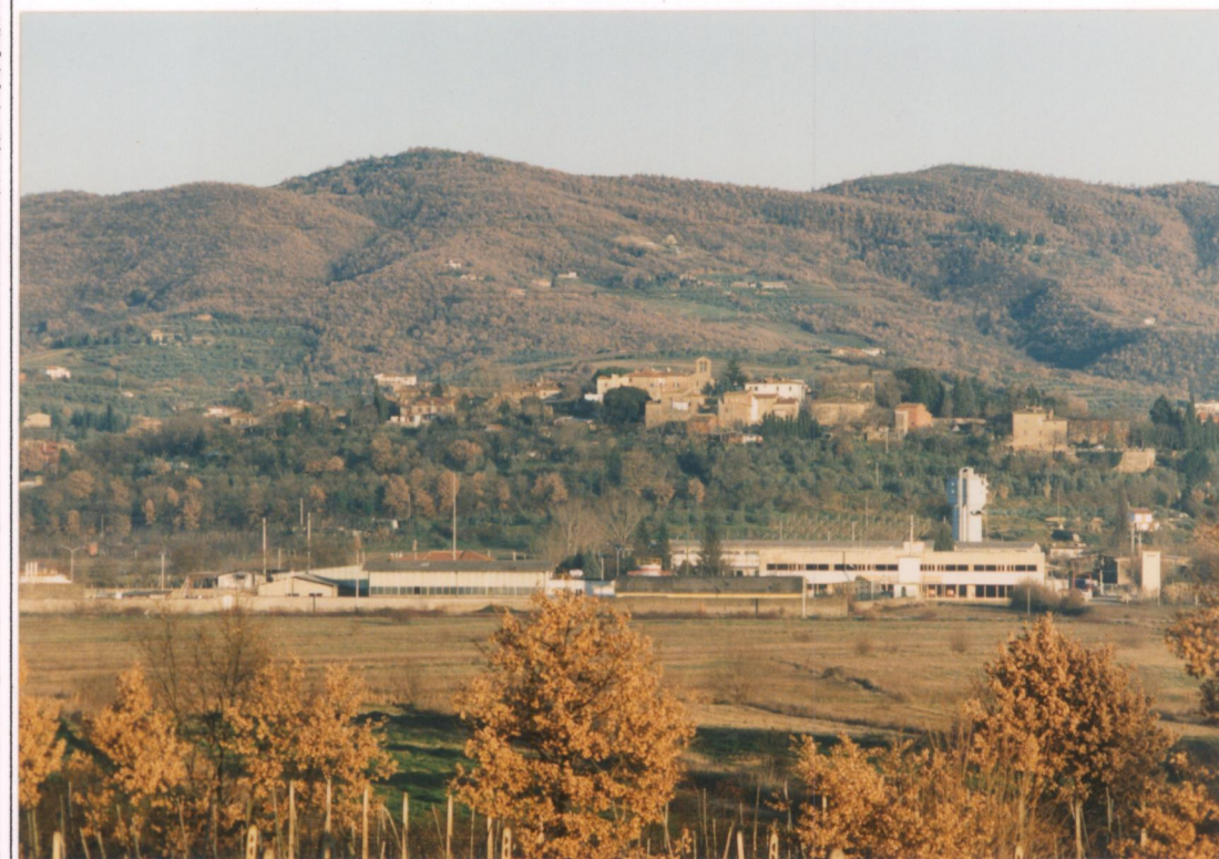
Particolare della collina di Puglia