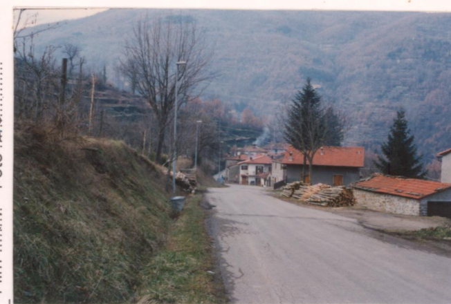
Film 144. Foto 29