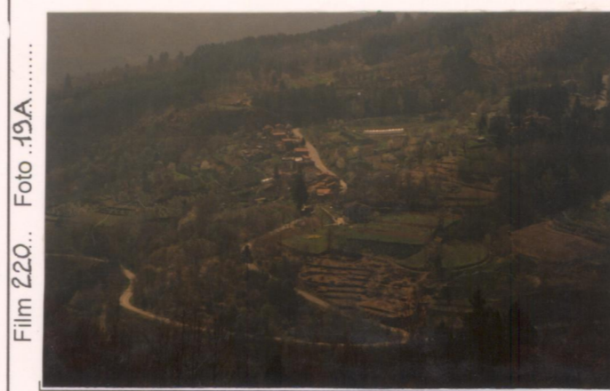
Film 220.. Foto 19A