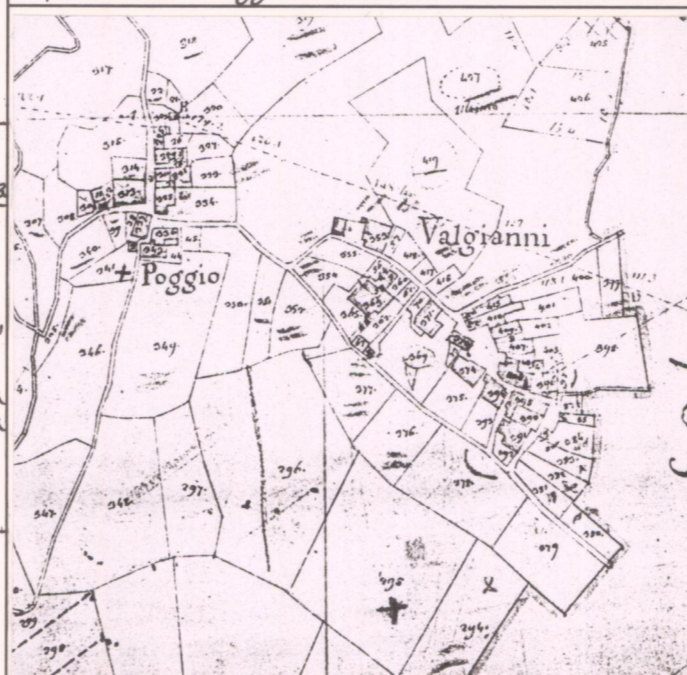
CATASTO LORENESE Sez. M f. 1