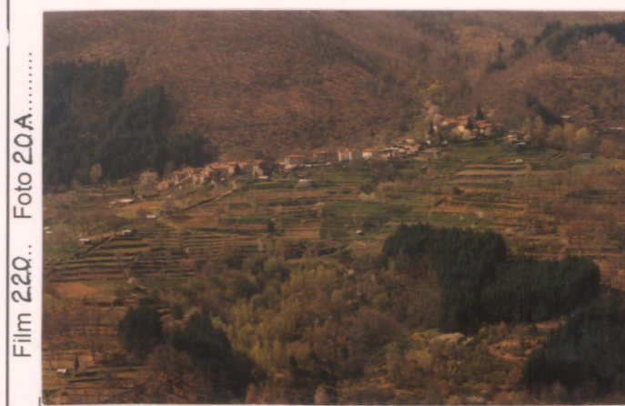
p.v. N.1... da Poggio Vertelli