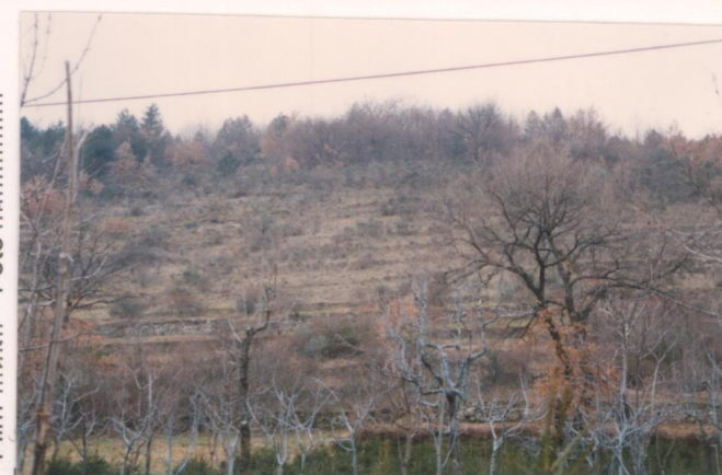
p.v. N. 5