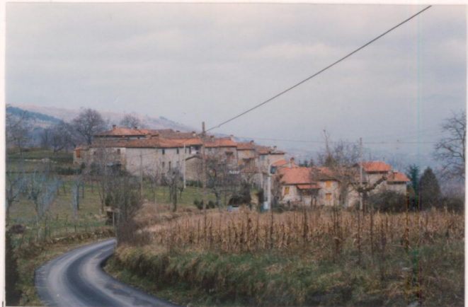
p.v. N. 2