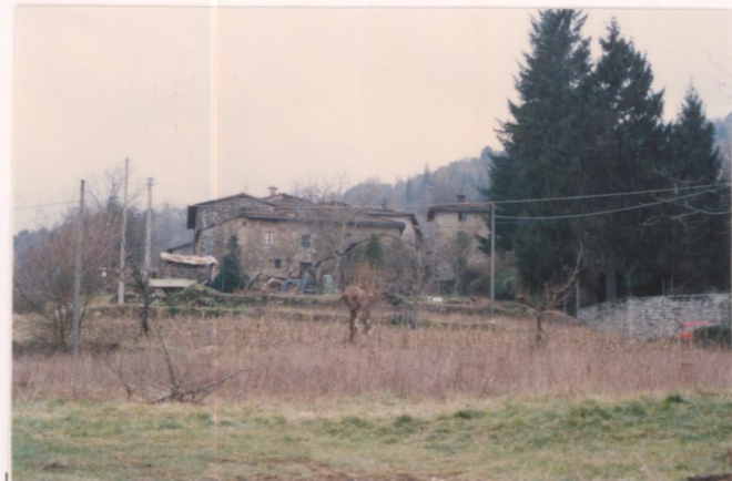
p.v. N. 3