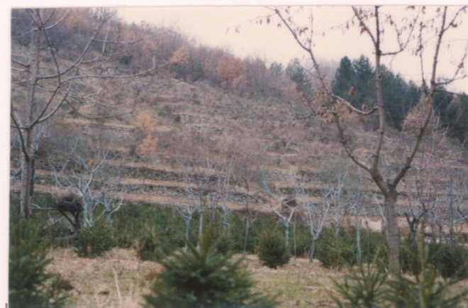
p.v. N. 4