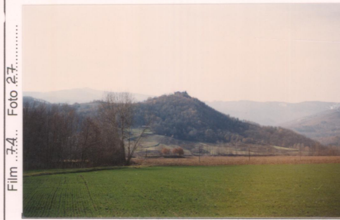
p.v. N.1... Dalla strada provinciale di Raggiolo...