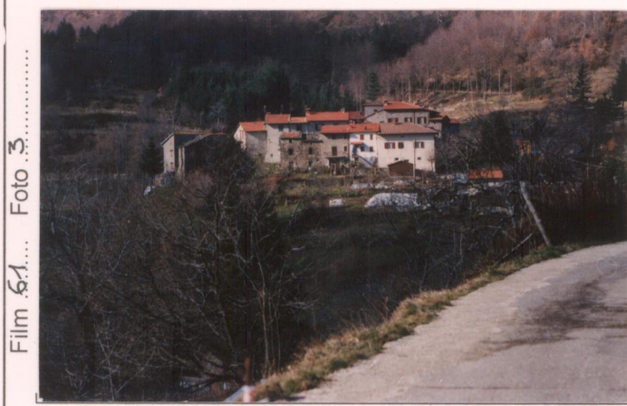
Film 61... Foto 3