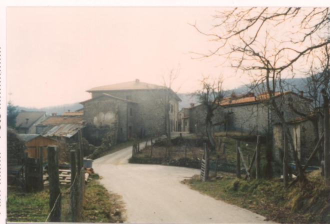
Film 72... Foto 20