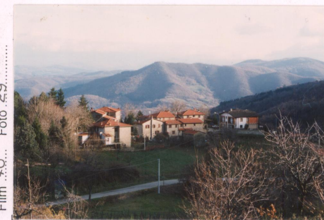
p.v. N. 2 La Villa