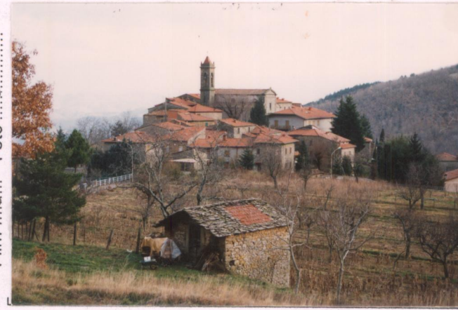
p.v. N. 1 Faltona