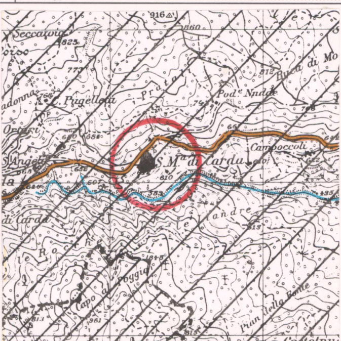
CATASTO LORENESE Sez. 0 f. 2