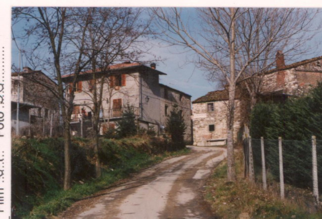
Film 6.1... Foto 3.6