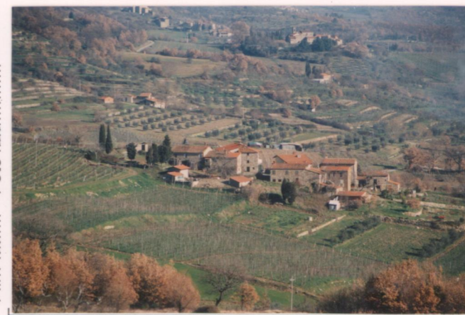
p.v. N.2... da Bibbiano