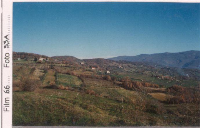
p.v. N.1... da Bibbiano

N.B. PC: prevalentemente coltivato PA: prevalentemente abbandonato A: abbandonato