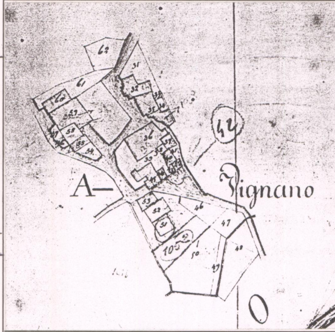
CATASTO LORENESE Sez. E f. 1