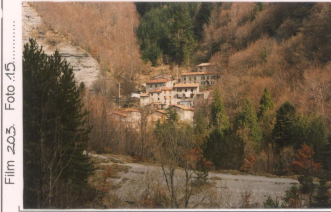
Film 203. Foto 15