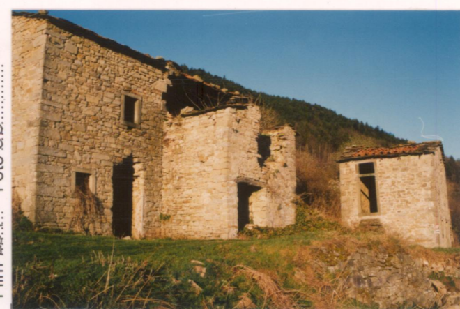
p.v. N. 1