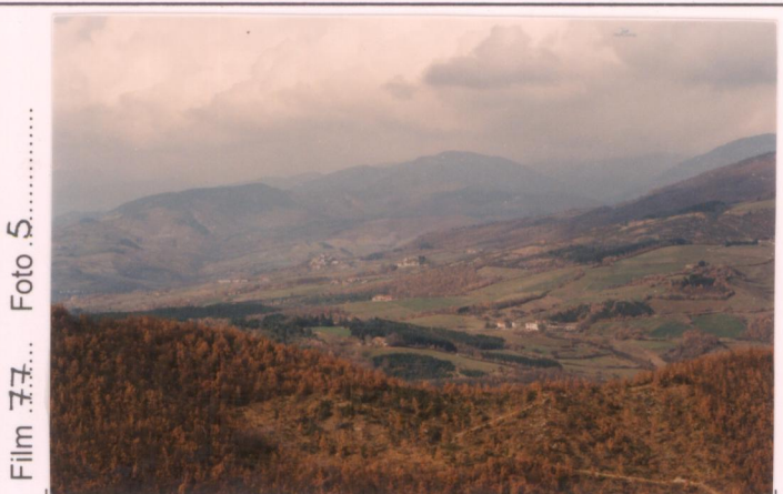
p.v. N. 8. Veduta verso casa colonica "Camparsena"