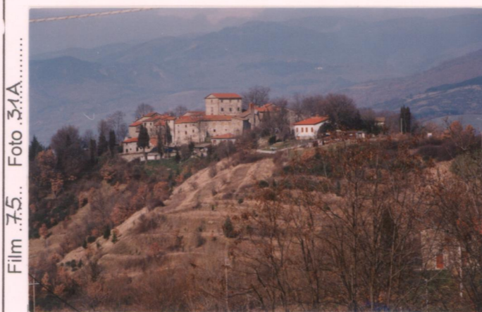
p.v. N.1... Dalla strada di accesso