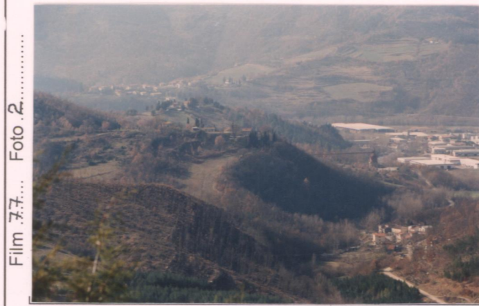
p.v. N. Da Sarna