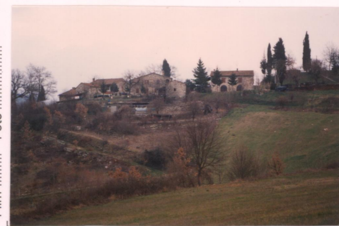
p.v. N.1. Dalla strada di accesso