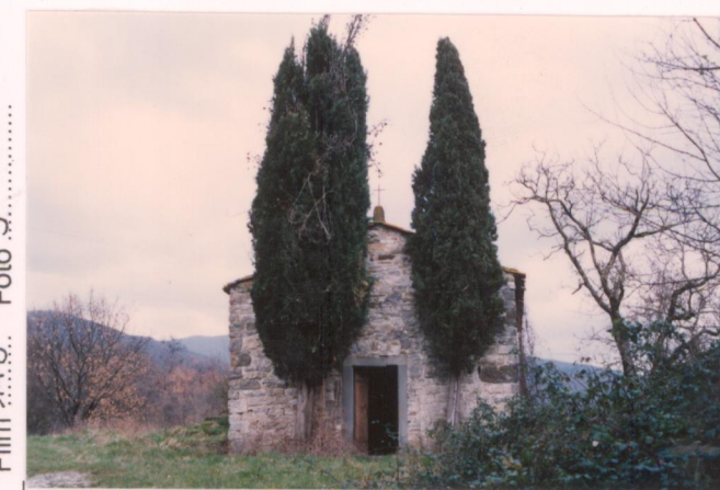
Film 14.5. Foto 14.5