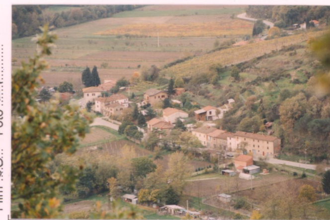
p.v. N.1 Da La Piaggia (zummata)