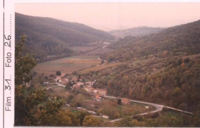
p.v. N.1 Da La Piaggia