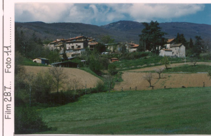
Film 287... Foto 1.A