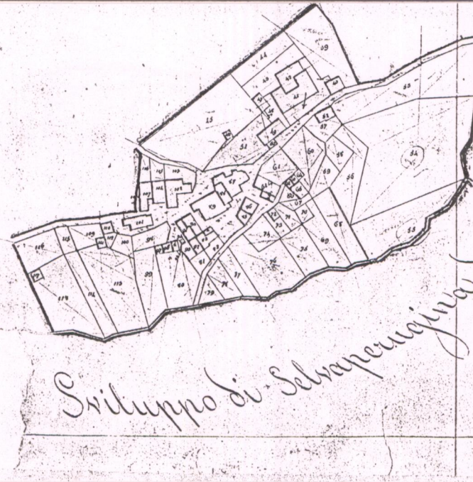
Sviluppo di Selva Perugina