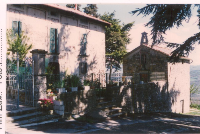
Film 288... Foto 7