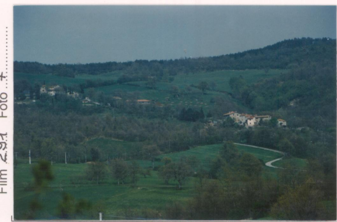
p.v. N. Da S. Cassiano