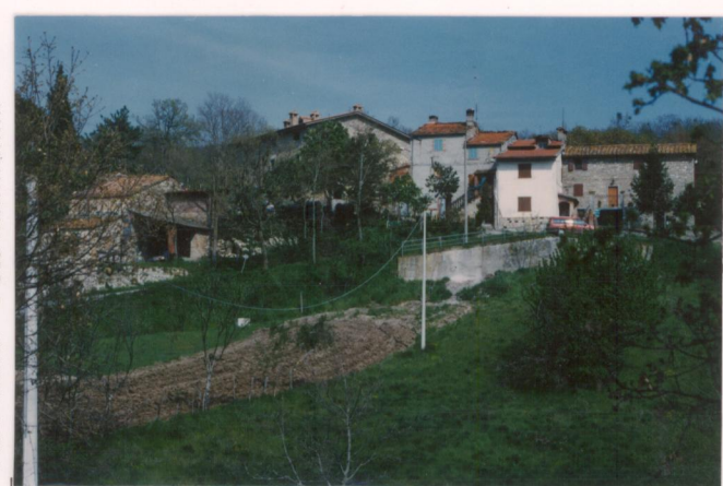
p.v. N. 1 Da strada di accesso