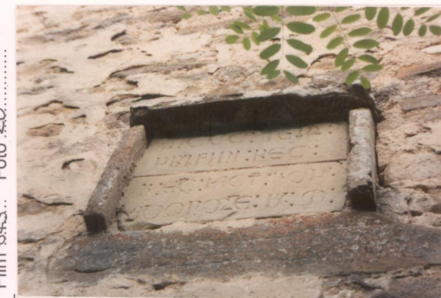
Film 643. Foto 20.