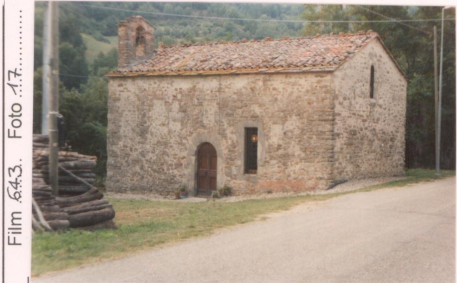
Film 643. Foto 17.