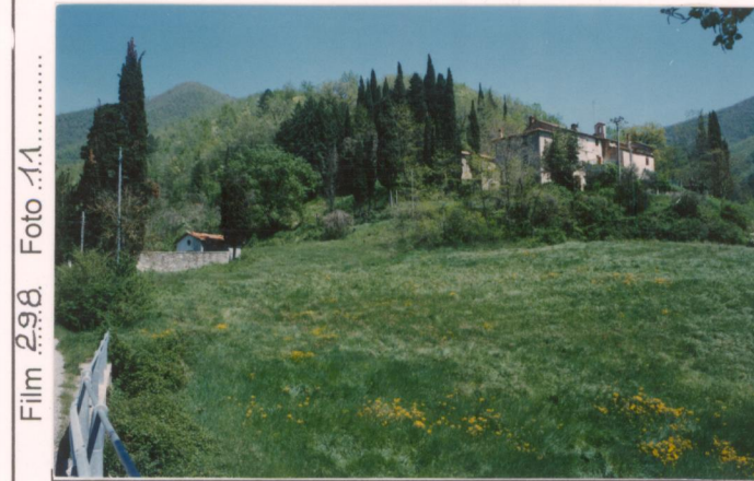
p.v. N. 1. Dalla strada comunale della Montagna.