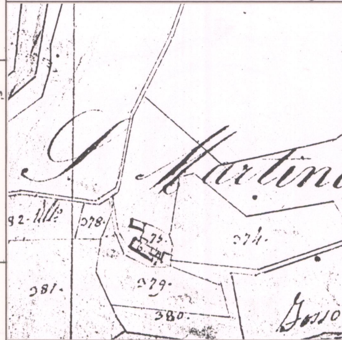
CATASTO LORENESE Sez. B f. 2