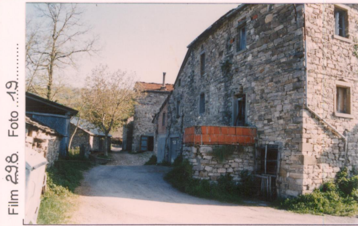
Film 298 Foto 19