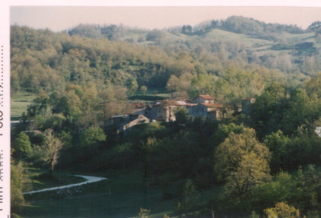
p.v. N.2 Dalla strada per Rofelle (in una posizione più bassa del pv.1)