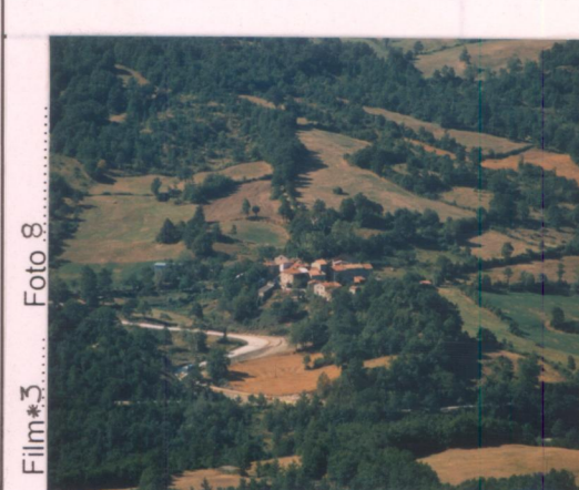
p.v. N. Da Rofelle