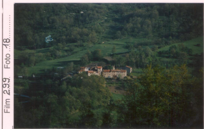
p.v. N.1. Dalla strada per Rofelle presso il Poggio