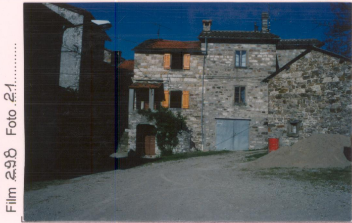
Film 298 Foto 21