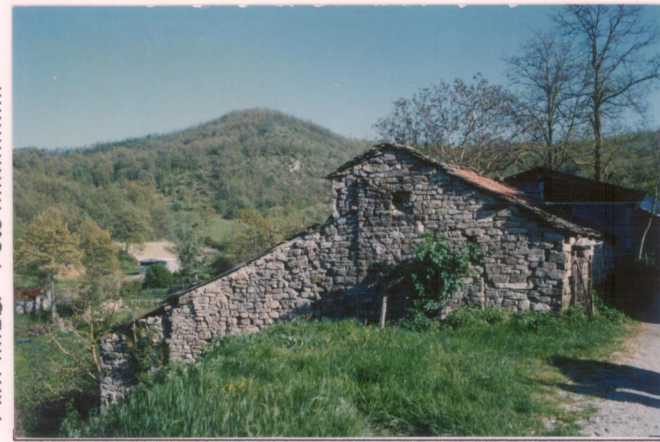
Film 298 Foto 20