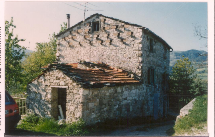
Film 298 Foto 18