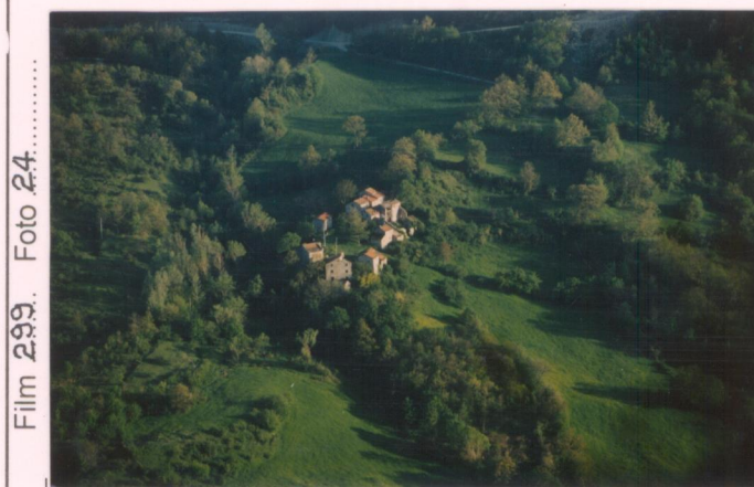
Film 299. Foto 24.