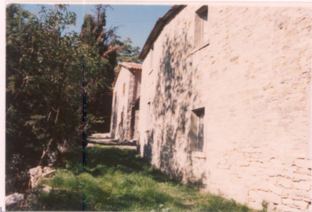
p.v. N. 7