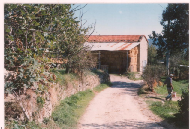
p.v. N. 12