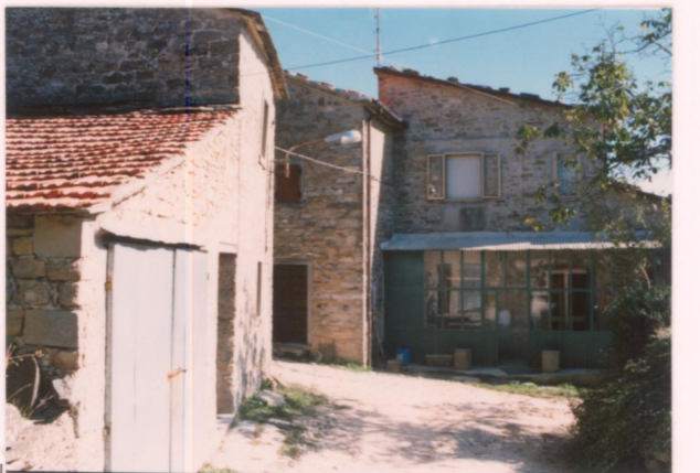
p.v. N. 11