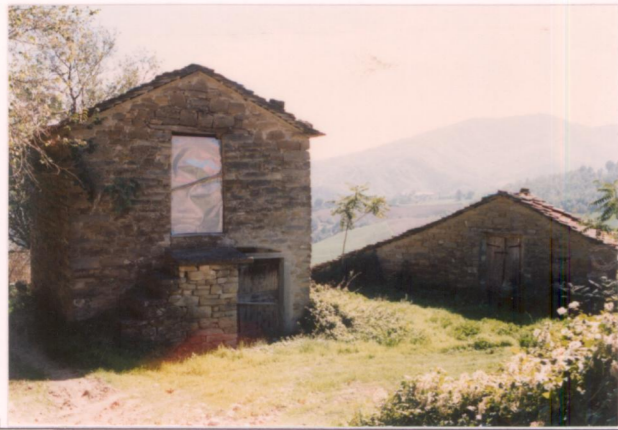
p.v. N. 6