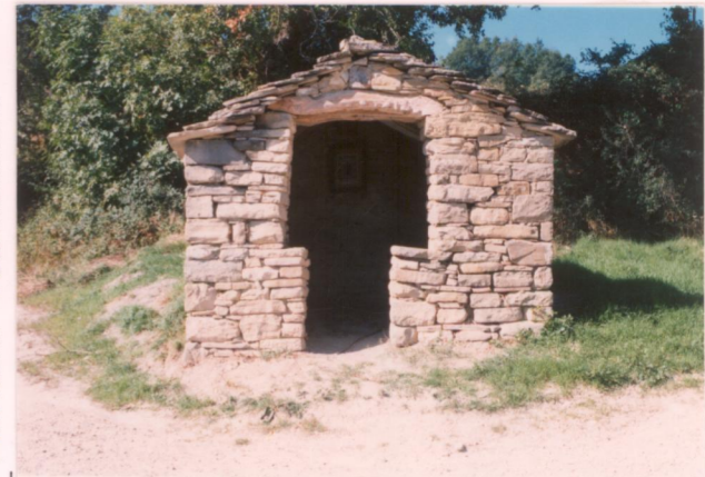
p.v. N. 13