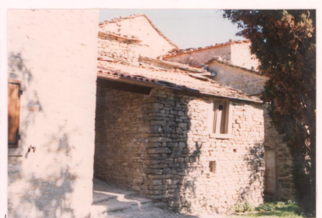
p.v. N. 9