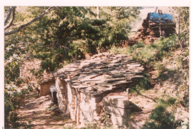
p.v. N. 17