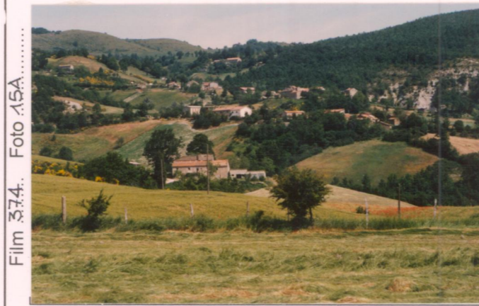
Film 374. Foto 15A

N.B. PC: prevalentemente coltivato PA: prevalentemente abbandonato A: abbandonato