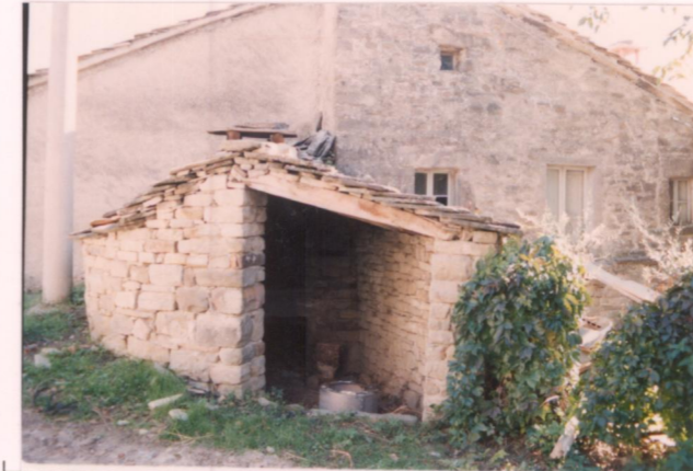
p.v. N. 16