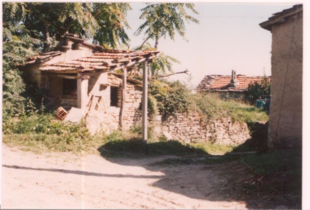
p.v. N. 15