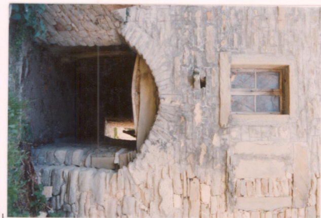
p.v. N. 8