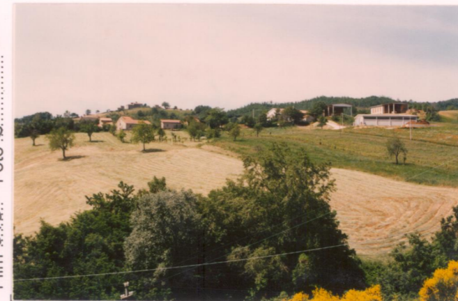
Film 376. Foto 9