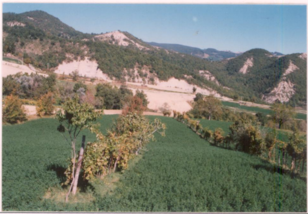
p.v. N. 14