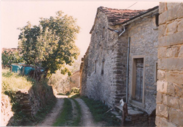
p.v. N. 10