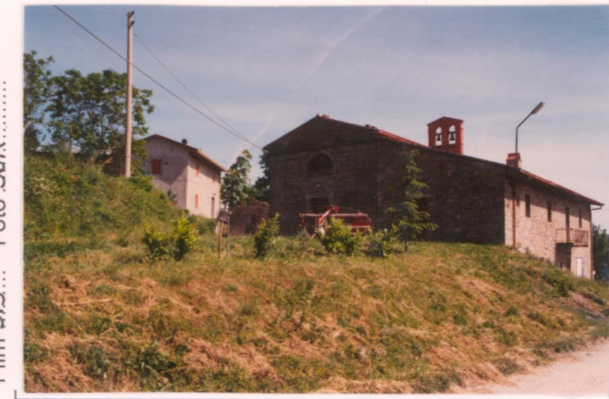
p.v. N.1... S. Andrea dalla Provinciale Sestinese