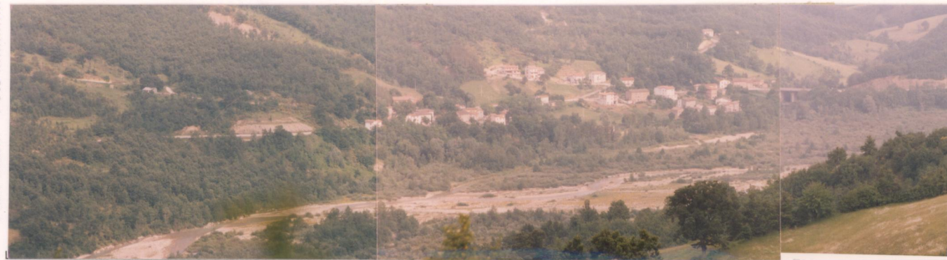
p.v. N. Ca' Raffaello da Ortale