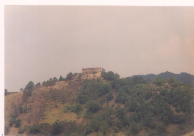
p.v. N.1. Montevocchio visto da Ca' Bastianelli