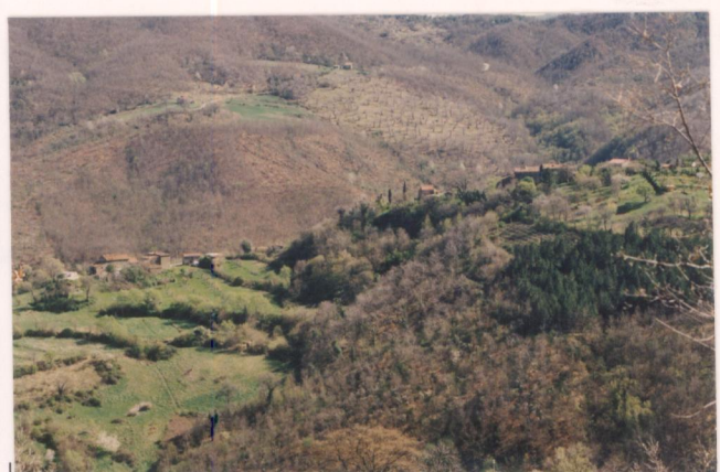
Film 88.5. Foto 23.....