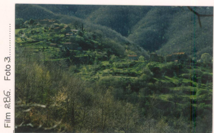
Film 88.6. Foto 3.....