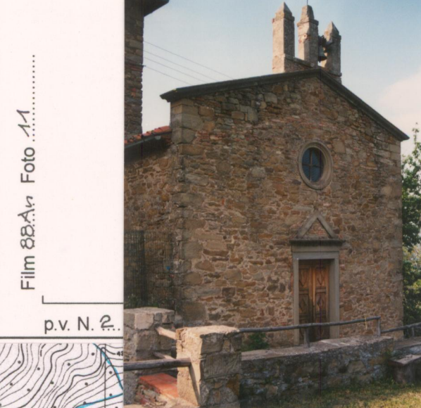
Film 88.4n Foto 11.....