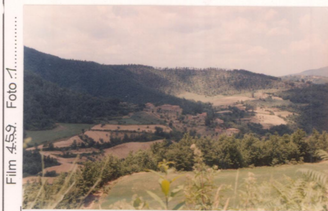
p.v. N. Dalla strada per Badia S. Veriano