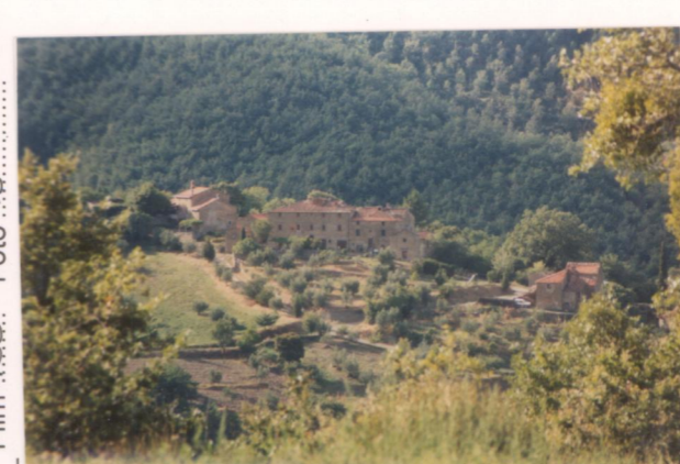
p.v. N. vista da Novigliano