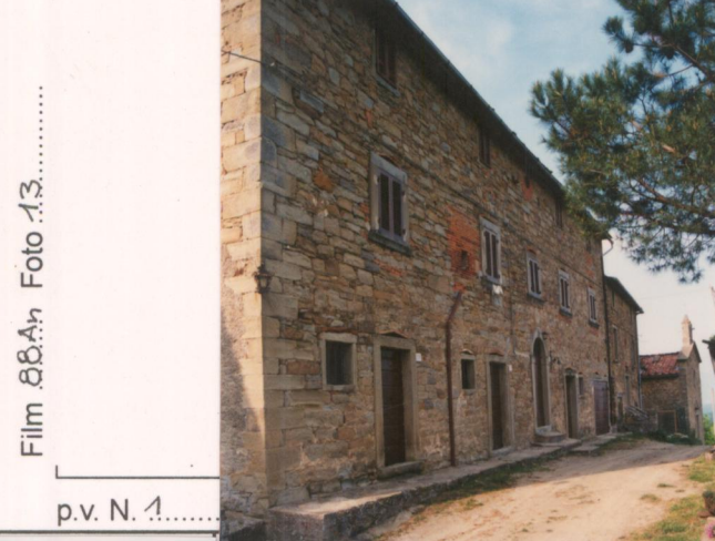
Film 88.4n Foto 13.....