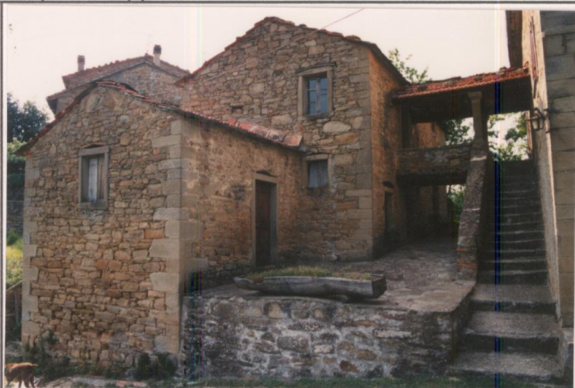
Film 88 Foto 16