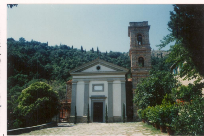
Film 4.13 Foto 34A