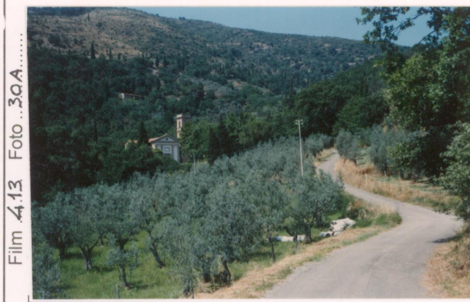
Film 4.13 Foto 30A