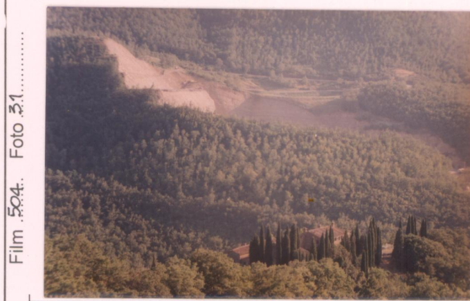
p.v. N. 1. Sullo sfondo la cava