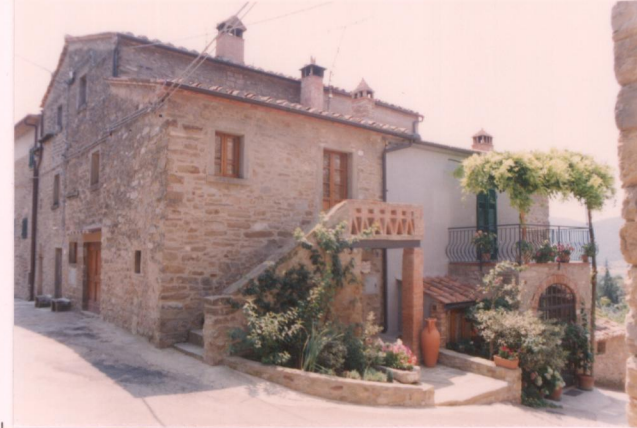
p.v. N. 13