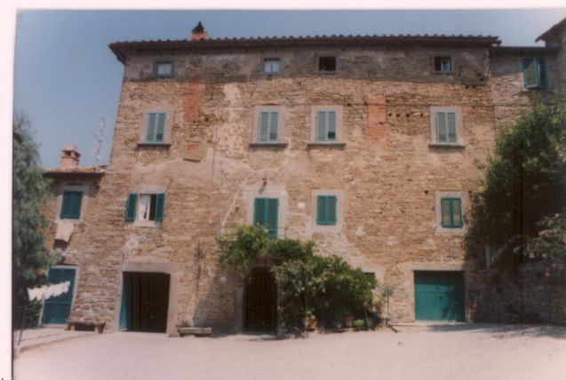
p.v. N. 9