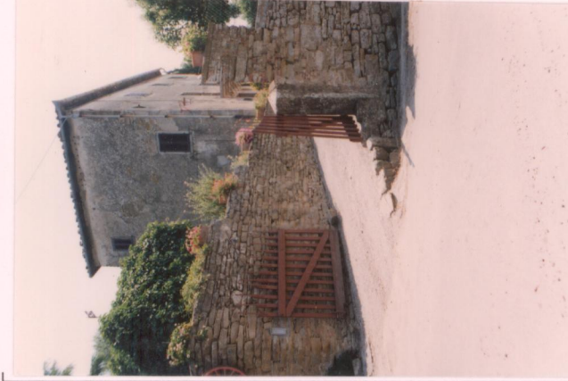
p.v. N. 5 Villa dell'Olivo