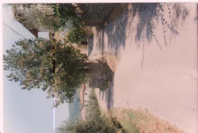
p.v. N. 8