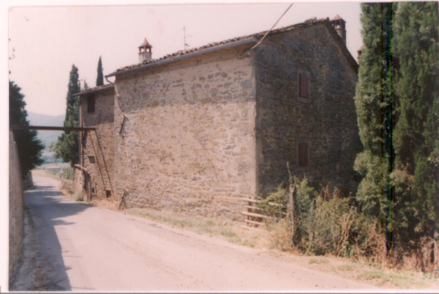
p.v. N. 3