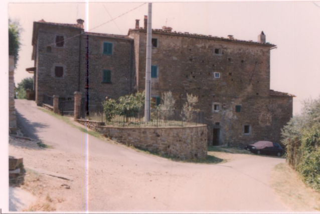
p.v. N. 4