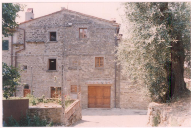
p.v. N. 11