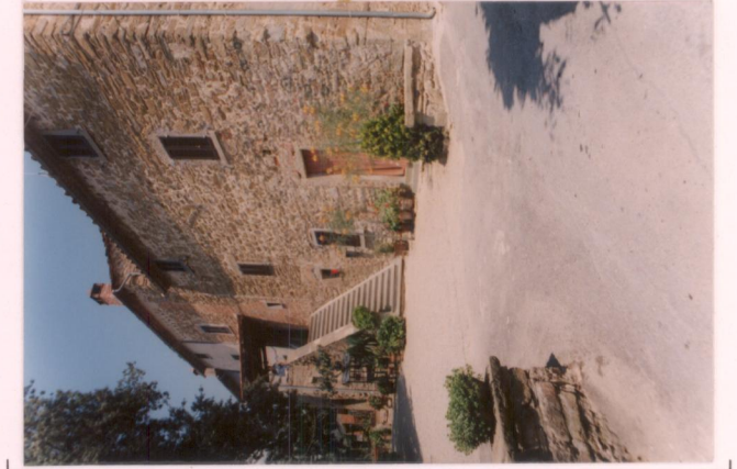
p.v. N. 6