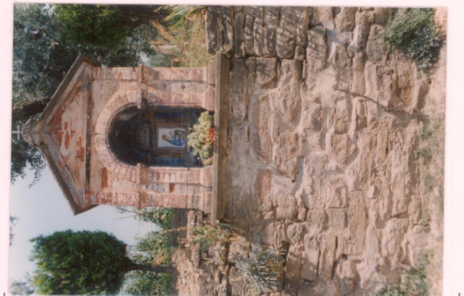
p.v. N. 14