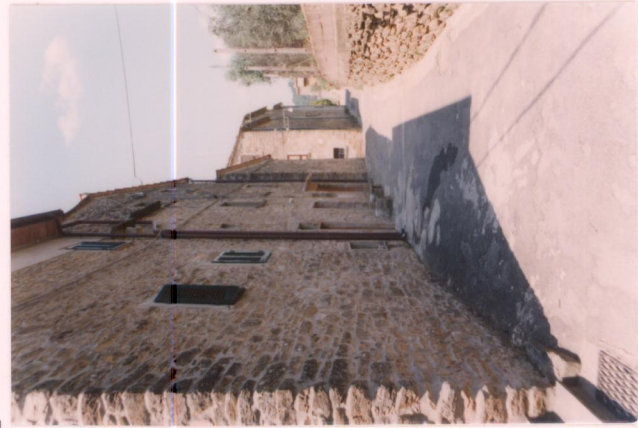
p.v. N. 16 La strada interna