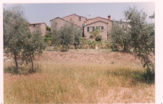
p.v. N. 18 veduta dagli oliveti