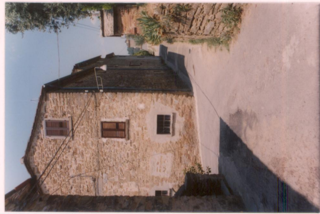
p.v. N. 15