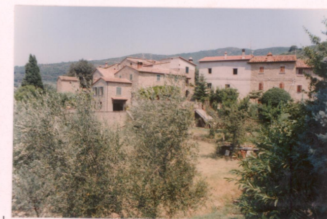
Film 5.1.2. Foto 06