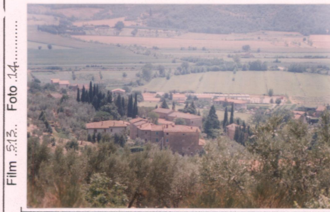
Film 5.1.3. Foto 14