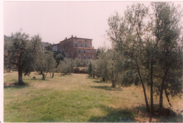
p.v. N. 17