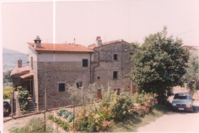
p.v. N. 12