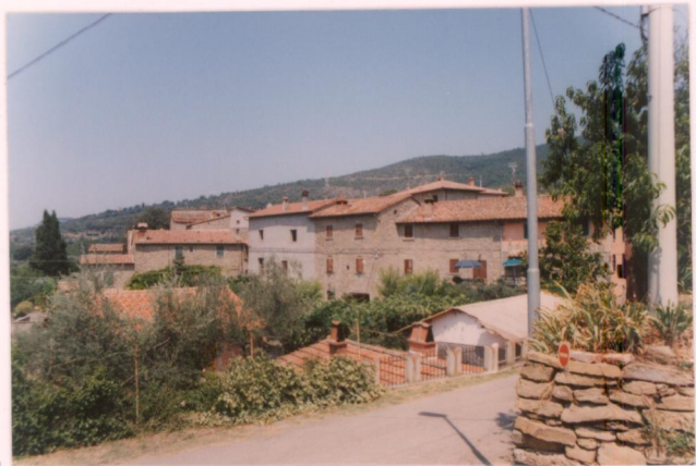
p.v. N. 7