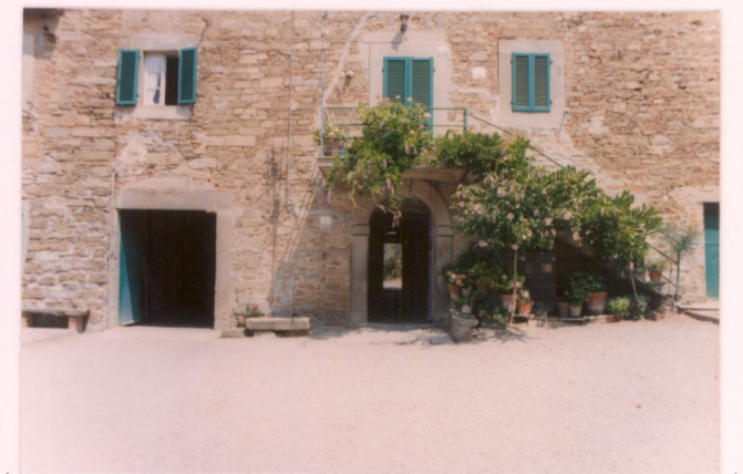
p.v. N. 10