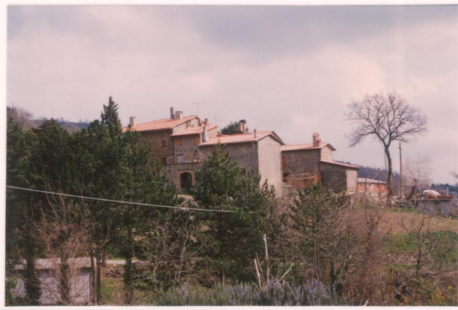
p.v. N. 6.....