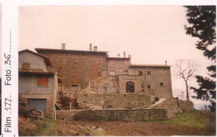
p.v. N. 1... Fabbrica da Casa Vecchia