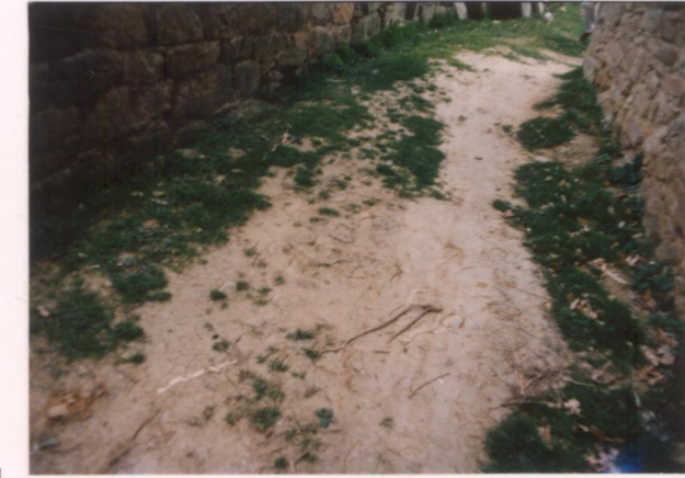
p.v. N. 8... Muri... di contenimento... antichi.....