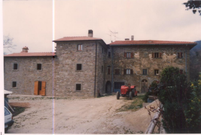
p.v. N. 7.....