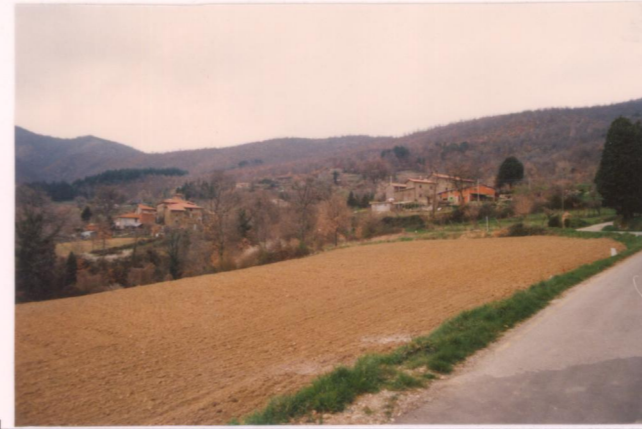
p.v. N. 4... Casa Vecchia... e... Fabbrica.....