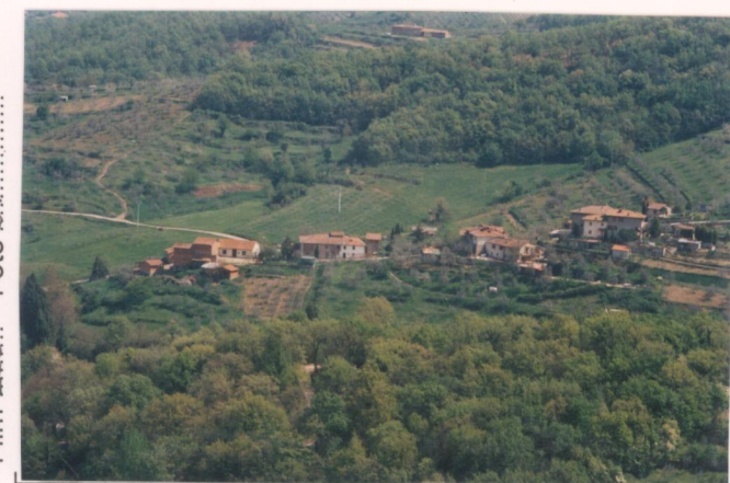
p.v. N. 2. Veduta da C. Volpi (strada per Parco).....