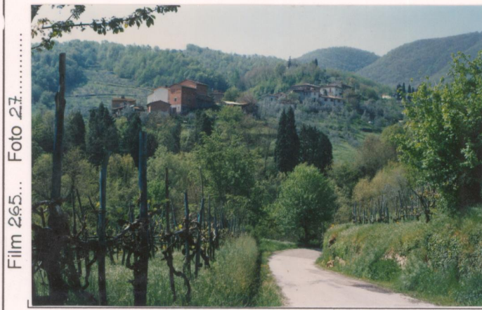
p.v. N. 1. Veduta dalla strada sotto Massa.....