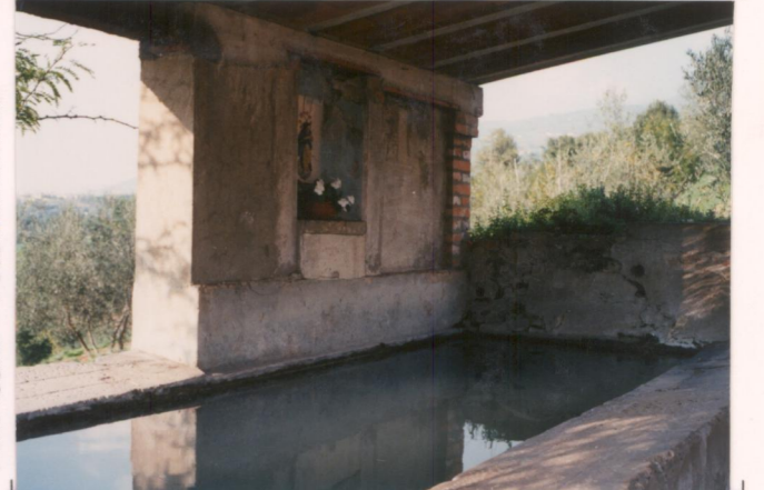
p.v. N. 10... Lavatoi.....