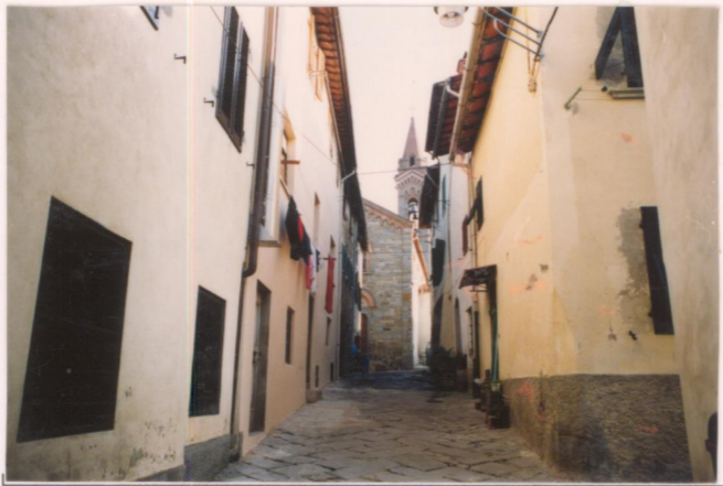
p.v. N. 8.....