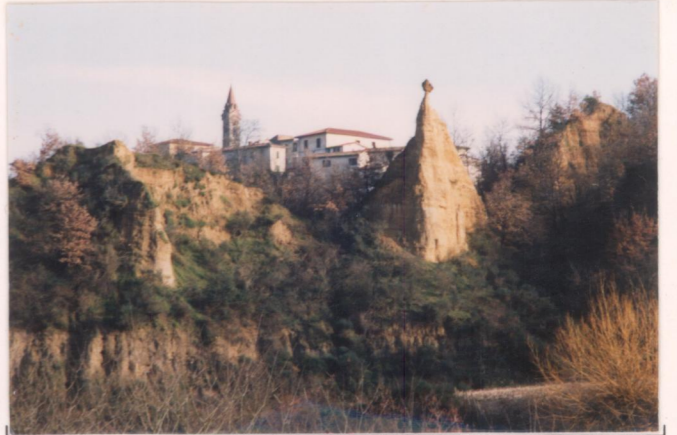
p.v. N. 6. veduta dalla vallecchia di Botro Spina.....