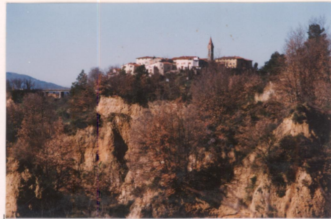
p.v. N. 4. veduta dal cimitero di Passignano.....