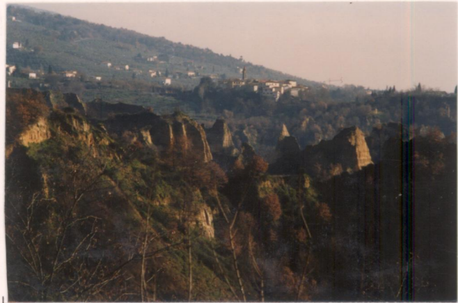
p.v. N. 3. veduta dalla Strada comunale dei Poggi.