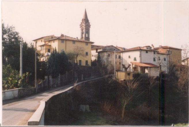
p.v. N. 7.....