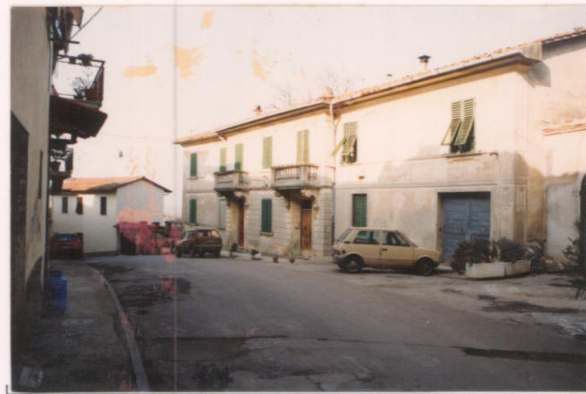
p.v. N. 9.....