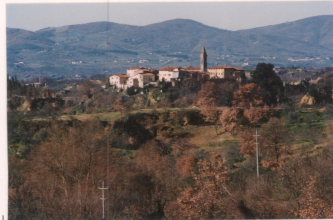
p.v. N. 5. veduta da Malva.....