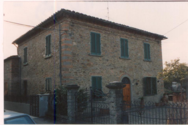
p.v. N. 7