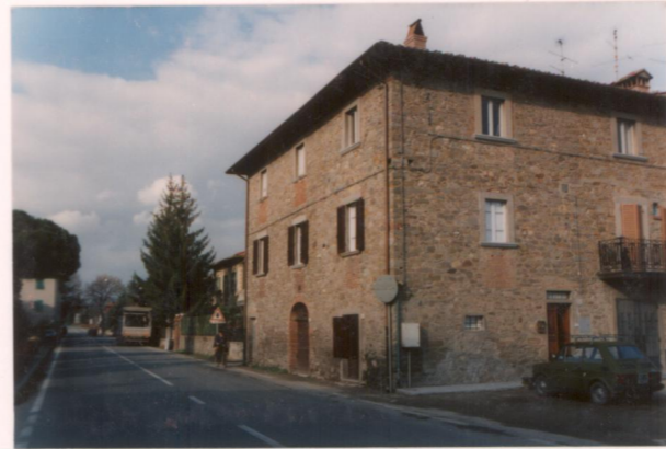
p.v. N. 8