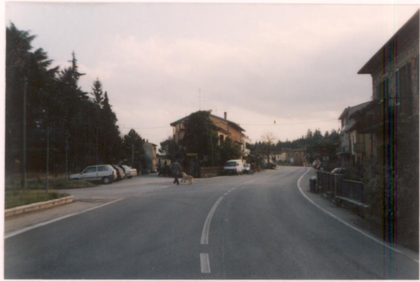
p.v. N. 6