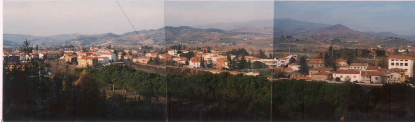
p.v. N. 1: da Poggio del Ponte