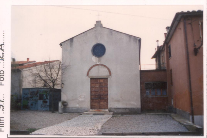
Film 97... Foto 12A.....