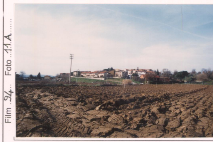
Film 94... Foto 11A.....