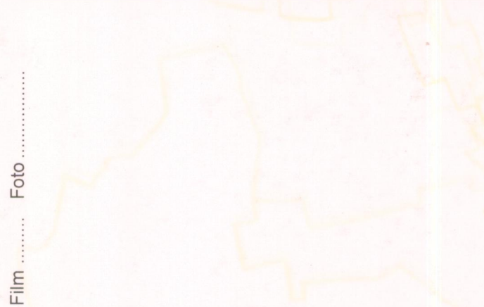
Film ..... Foto .....