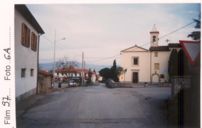
Film 27... Foto 6A