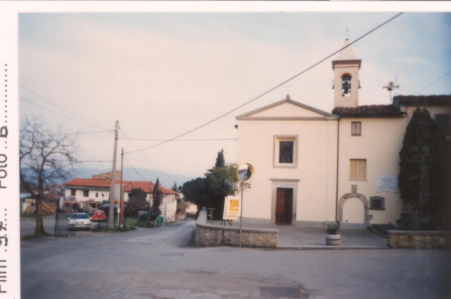
Film 27... Foto 6