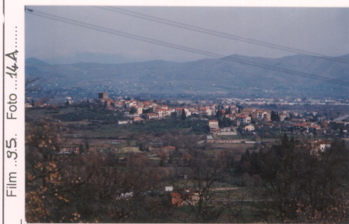
p.v. N. 1: "Poggiola" de Viscione (Battifolle)