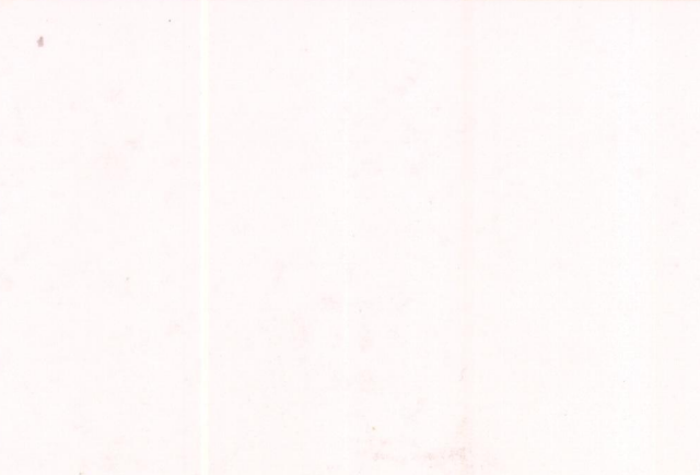
Film ..... Foto .....