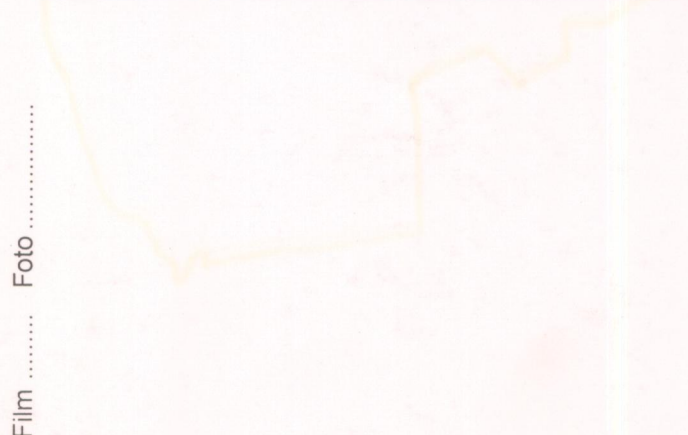
Film ..... Foto .....