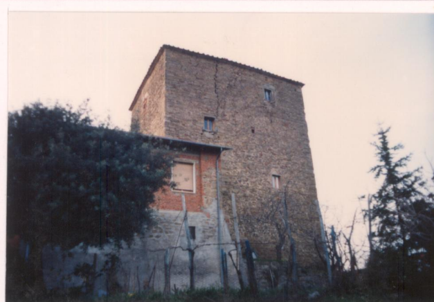
Film 27... Foto 5