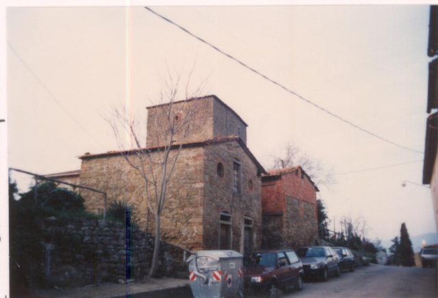
Film 27... Foto 4