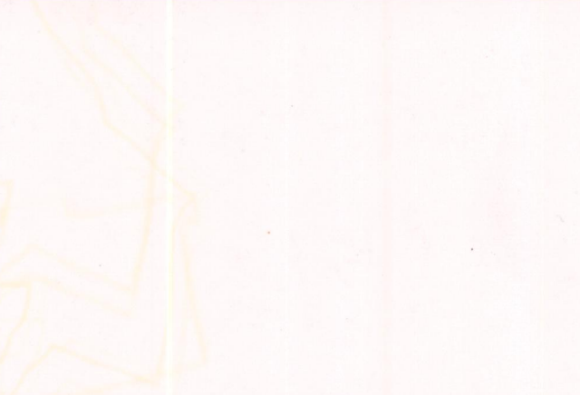
Film ..... Foto .....