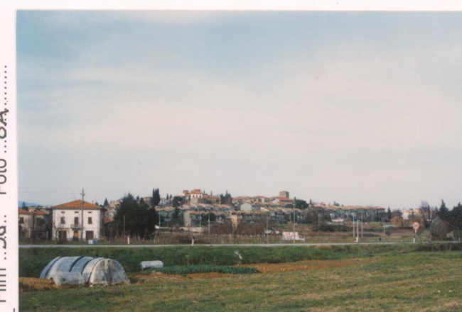
p.v. N. 2