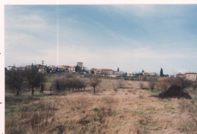
Film 24... Foto 24A