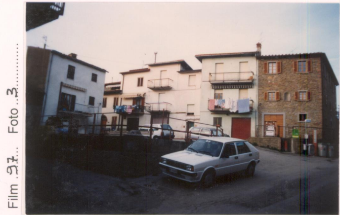
Film 27... Foto 3