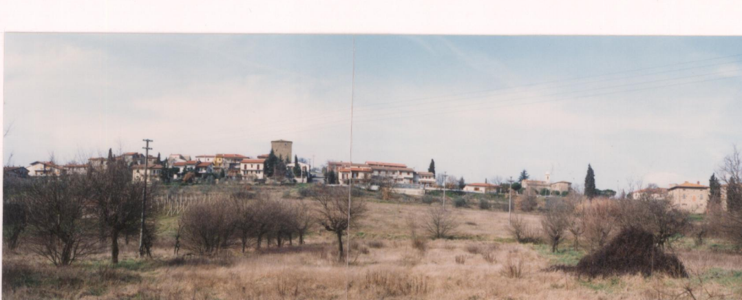
Film 24... Foto 22A-23A