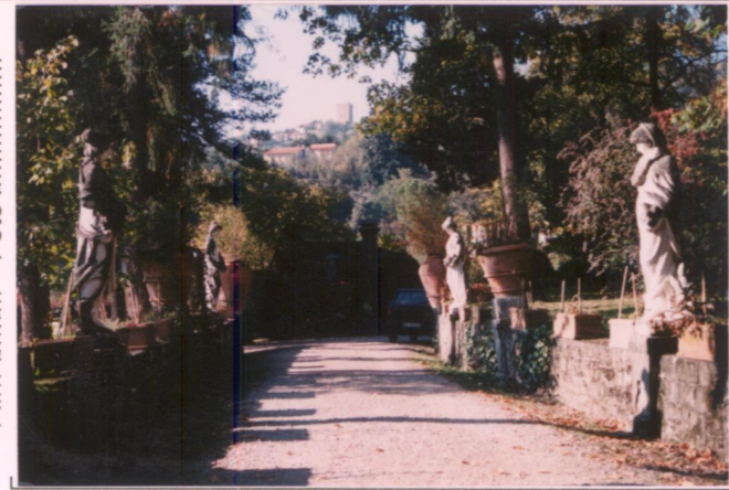
Film 64.7... Foto 2.0 p.v. N.