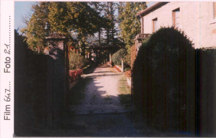
Film 64.7... Foto 2.1 p.v. N.