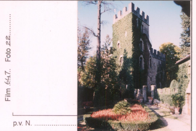
Film 64.7... Foto 2.2 p.v. N.