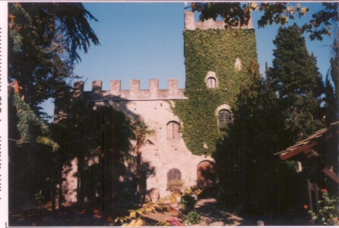
Film 64.7... Foto 2.5 p.v. N.