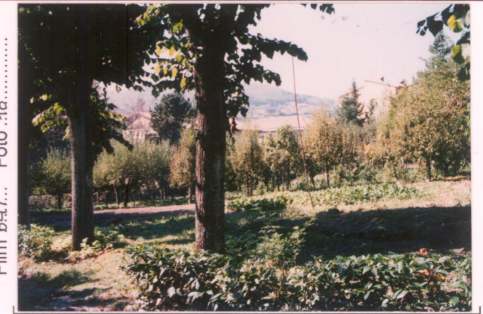
Film 647... Foto 18