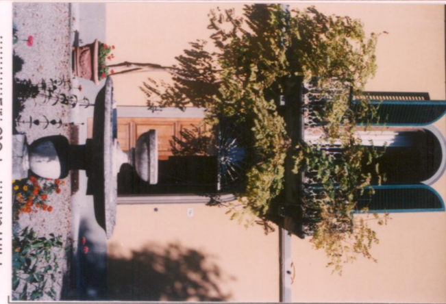
Film 647... Foto 19