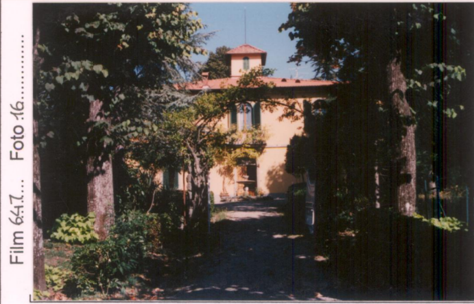
Film 647... Foto 16