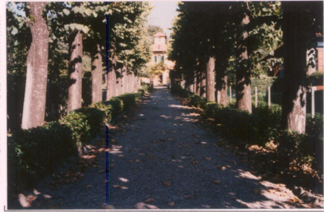
Film 647... Foto 17