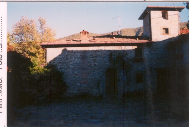
Film .650. Foto .5.....