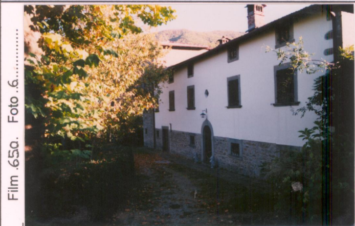
Film .650. Foto .6.....