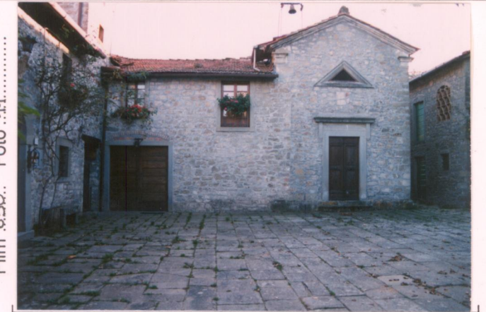
Film 650. Foto 11.