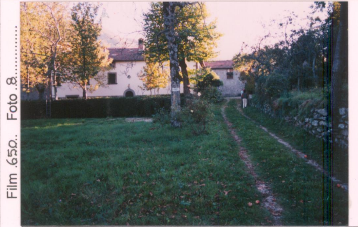
Film 650. Foto 8.