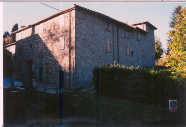
Film .650. Foto .2.....