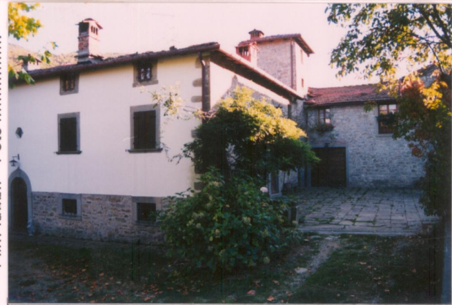
Film 650. Foto 7.