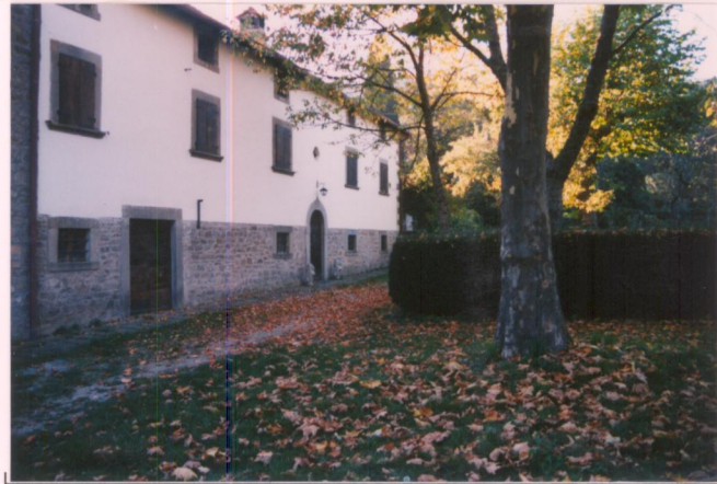
Film 650. Foto 10.