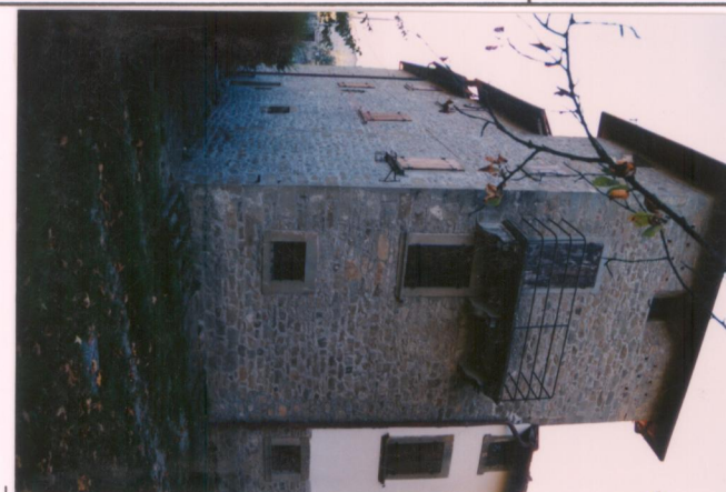
Film .650. Foto .9.....