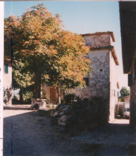
Film 672 Foto 16