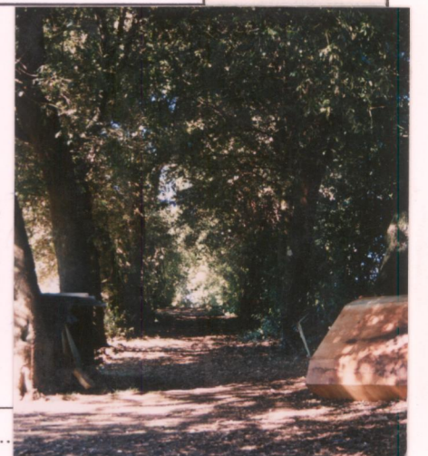
Film 672 Foto 22