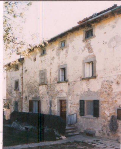
Film 672 Foto 21