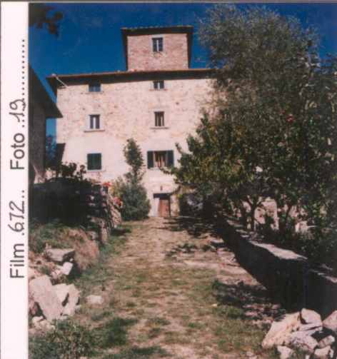
Film 672... Foto 19