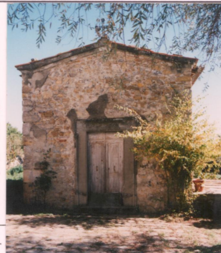
Film 672 Foto 18