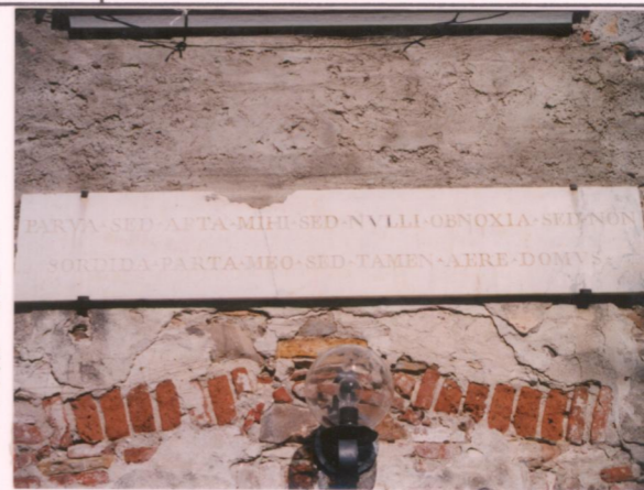
Film 672 Foto 17