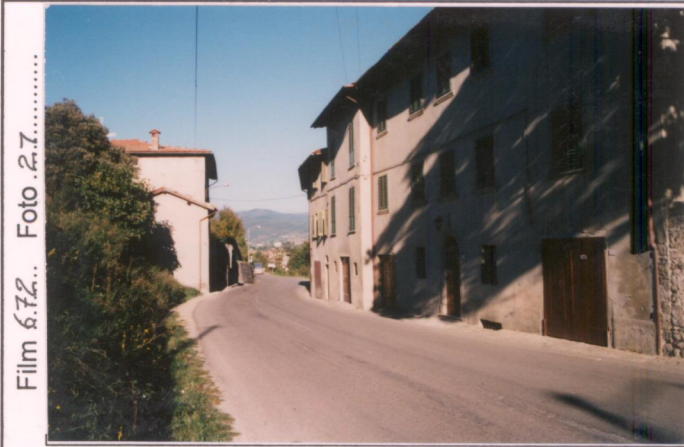
Film 6.72... Foto 2.7