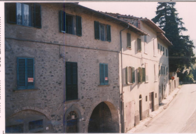
Film 6.72... Foto 2.8