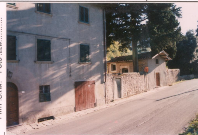
Film 6.72... Foto 2.8