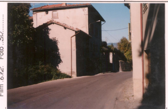
Film 6.72... Foto 3.0