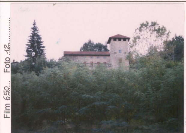
Film 650... Foto 12