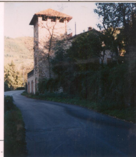
Film 672 Foto 31