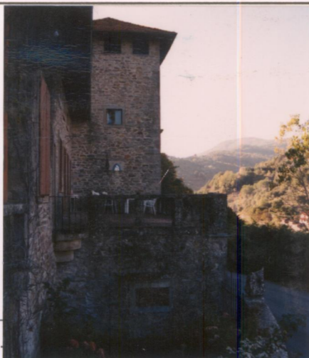
Film 672 Foto 55