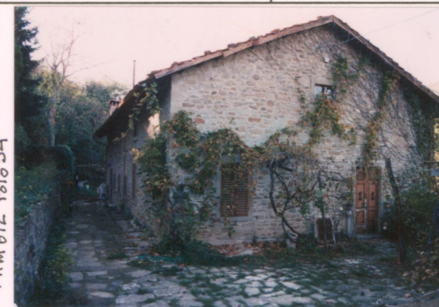
Film 672 Foto 34