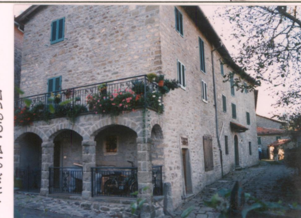
Film 672 Foto 52