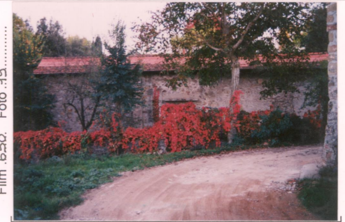
Film 6.50. Foto 19. p.v. N. ....