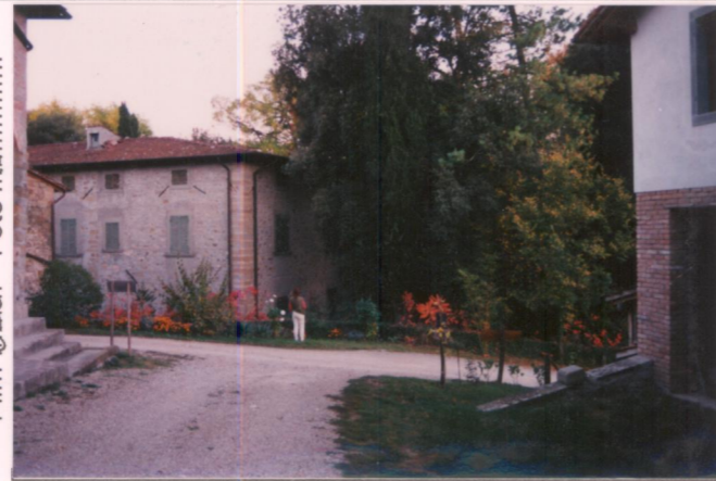
Film 6.50. Foto 18. p.v. N. ....