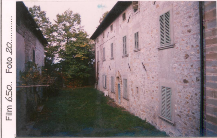
Film 6.50. Foto 20. p.v. N. ....