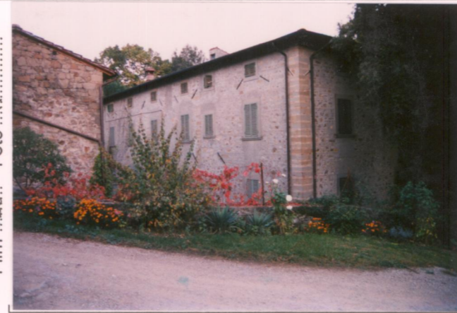
Film 6.50. Foto 17. p.v. N. ....