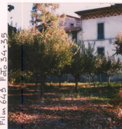
Film 645 Foto 34-35