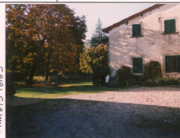
Film 675 Foto 4