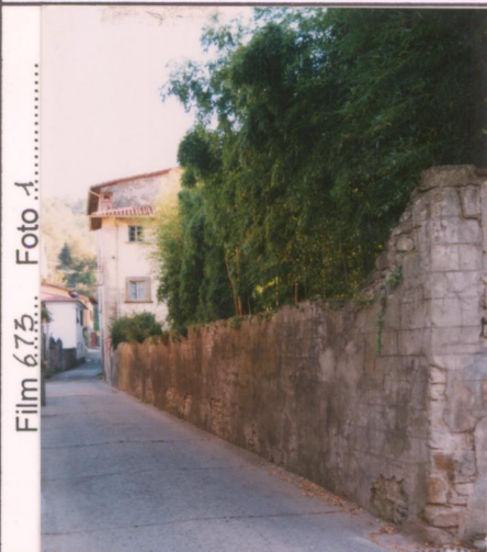
Film 675 Foto 1