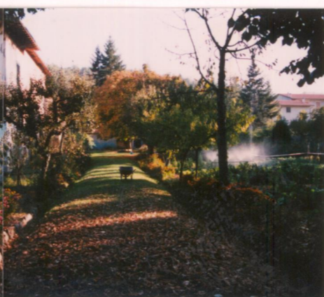
Film 675 Foto 3