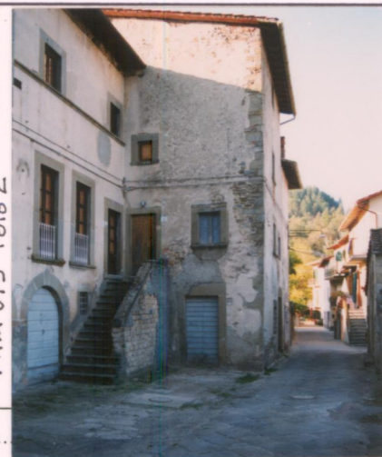
Film 675 Foto 2