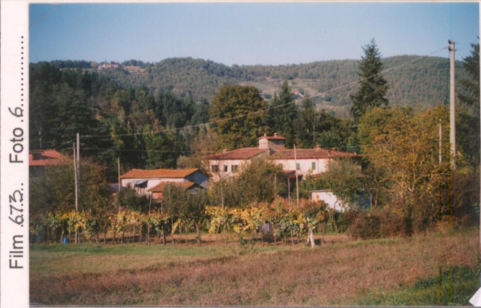
Film 675. Foto 6.