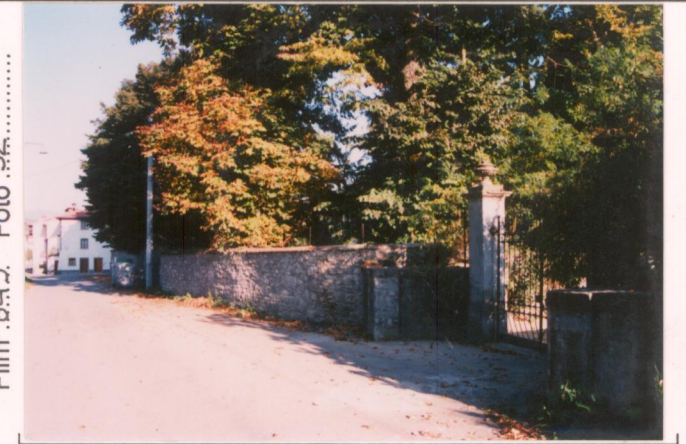
Film 649. Foto 32.