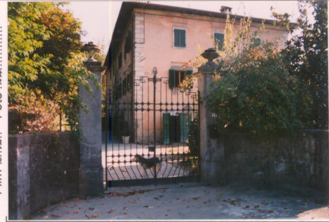
Film 649. Foto 35.