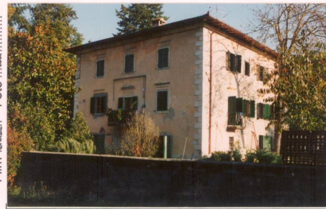
Film 682. Foto 12.