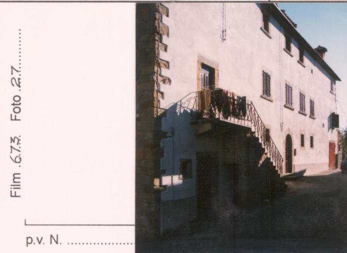
Film 6.7.3. Foto 27.....