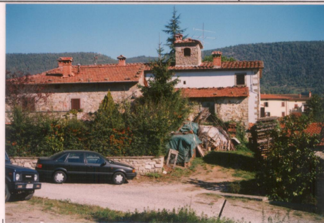
Film 6.7.3. Foto 26.....