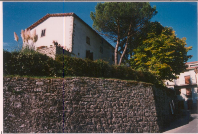
Film 6.7.3. Foto 29.....