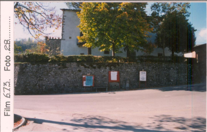
Film 6.7.3. Foto 28.....