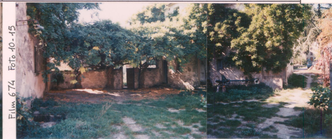
Film 6.74 Foto 10-15