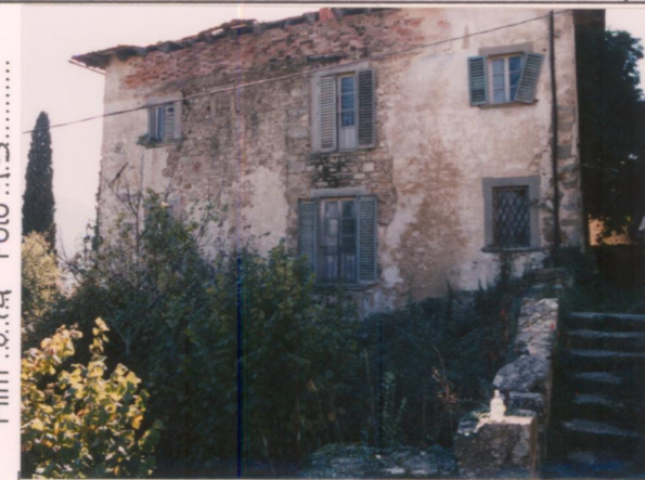
Film 6.74 Foto 13