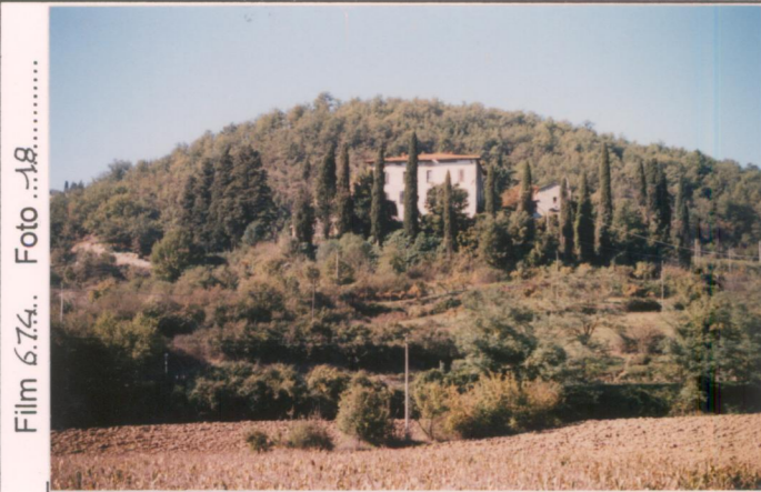
Film 6.74. Foto 18