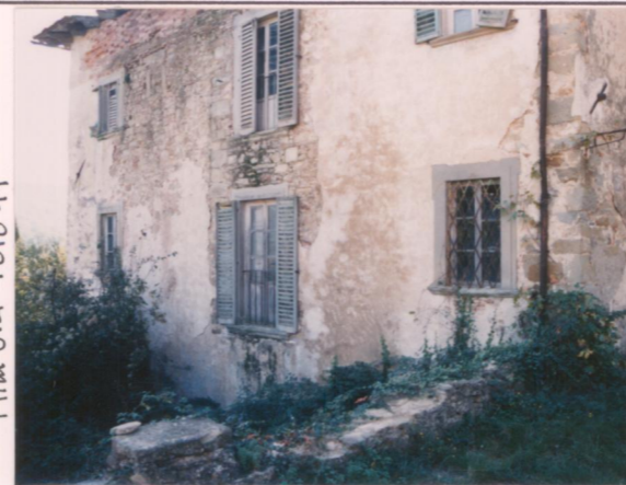
Film 6.74 Foto 11