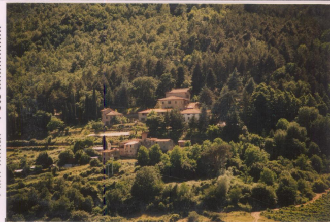
Film 380... Foto 21