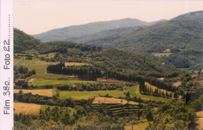
Film 380... Foto 22