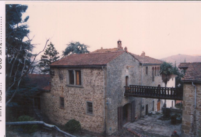
Film 380... Foto 2A