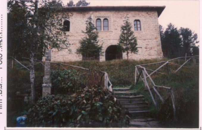
p.v. N. ....