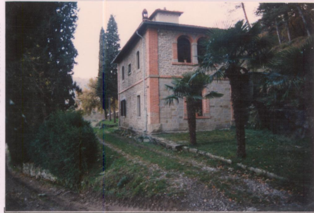
p.v. N. ....