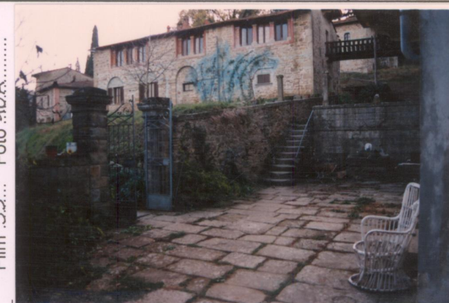
Film 380... Foto 10A