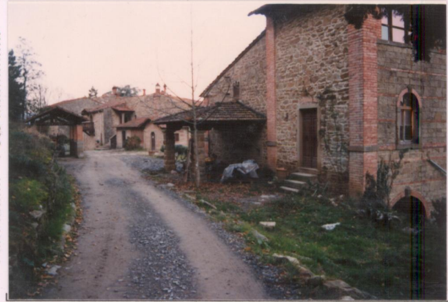
p.v. N. ....