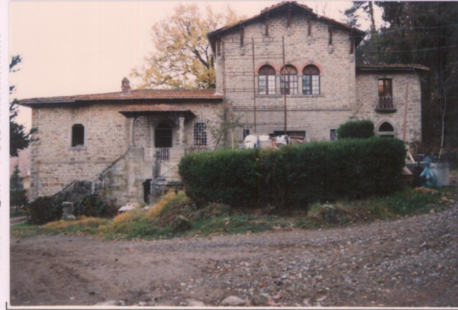
p.v. N. ....