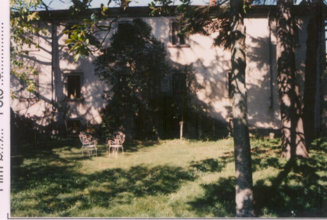
Film 6.7.7... Foto 6.....