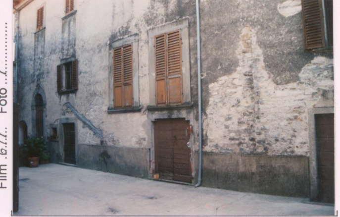
Film 6.7.7... Foto 7.....