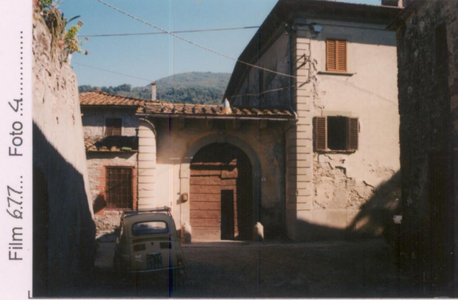
Film 6.7.7... Foto 4.....