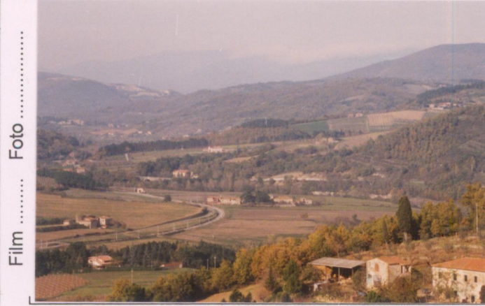
Film ..... Foto .....